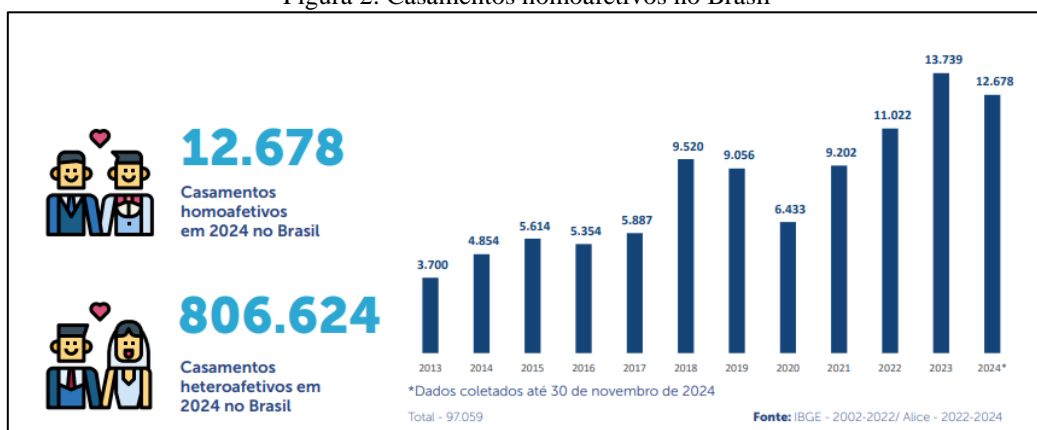
Figura 2: Casamentos homoafetivos no Brasil

Desde maio de 2013, com a publicação da Resolução nº 175 pelo Conselho Nacional de Justiça (CNJ), os Cartórios de Registro Civil passaram a realizar casamentos entre pessoas do mesmo sexo. Desde então, as unidades cartorárias em todo o país já formalizaram 97.059 celebrações de matrimônio homoafetivo.