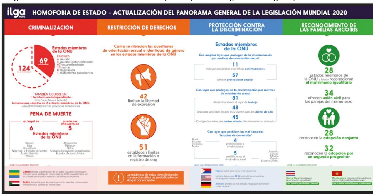
Figura 1 - Homofobia de estado - atualização do panorama global da legislação mundial em 2020

Com o recorte temporal necessário, a primeira vez em que a ONU considerou como Direitos Humanos os Direitos LGBTQIA+, por meio de seu Conselho de Direitos Humanos, materializou-se com a Resolução A/HRC/17/L.9 (United Nations, 2011a), também denominada Resolução 17/19. Na ocasião da Assembleia Geral em sua 17ª Sessão, o Conselho de Direitos Humanos expressou sua grave preocupação pelos atos de violência e discriminação, em todas as regiões do mundo, cometidos com base na orientação sexual e identidade de gênero das vítimas 1