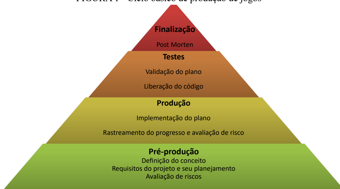
FIGURA 1 - Ciclo básico de produção de jogos