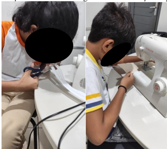
Figura 3 – Demonstração de habilidades cognitivas em resolução de problemas técnicos