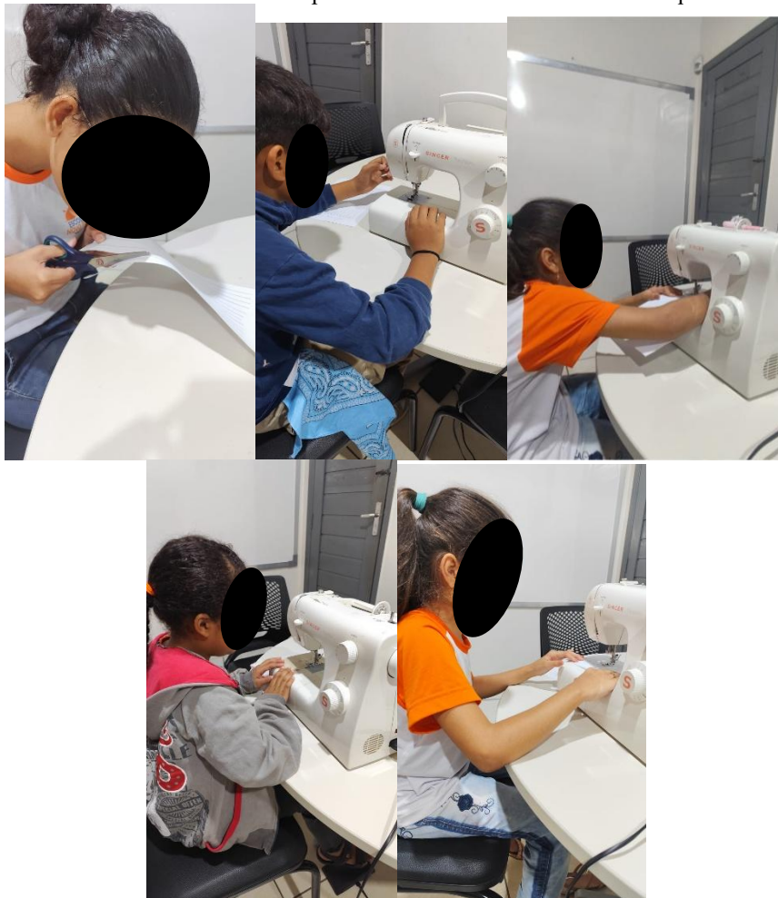
Figura 1 – Alunos na fase inicial de posicionamento das mãos sobre a máquina de costura