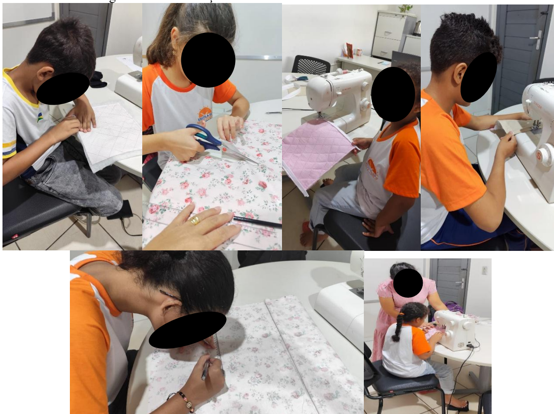
Figura 2: Demonstração do desenvolvimento de habilidades motoras

trabalhadas ao iniciarmos a apresentação do projeto, como posicionar as mãos e o pé no pedal. Ao iniciar a costura no tecido, os estudantes ficaram ansiosos, porém atentos as orientações da professora.