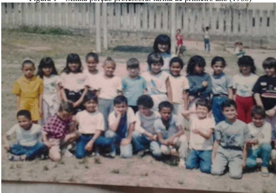
Figura 1 – Minha porção professora: turma de primeiro ano (1988)

Partindo da experiência docente, diminuimos a distância entre o real e o ideal no contexto da constituição identitária e da formação docente. Nós, professores somos constituídos por narrativas, pelos afetos, pelos nossos sonhos e ideais, pelos encontros e relações, que movimentam viver essa docência, que se relaciona com a busca do ideal, com o inquietar-se, que acende a produção acadêmica, a memória e a história de ser.