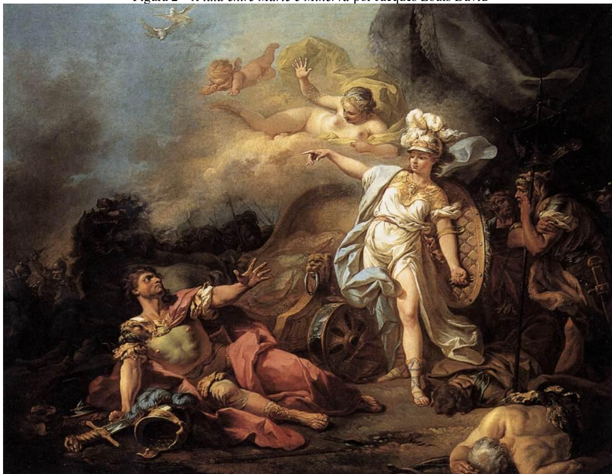
Figura 2 – A luta entre Marte e Minerva por Jacques Louis David