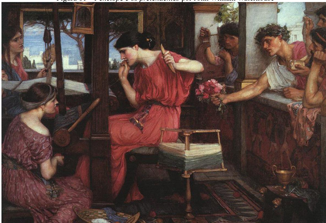
Figura 01 – Penélope e os pretendentes por John William Waterhouse

Para efeito de ilustração temos, a seguir, uma pintura de Penélope produzida pelo pintor John William Waterhouse: