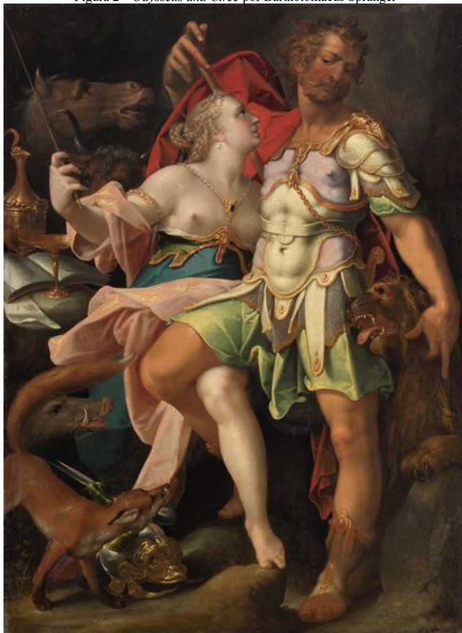
Figura 2 – Odysseus and Circe por Bartholomaeus Spranger