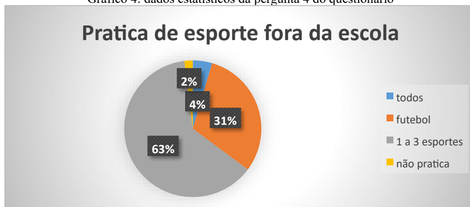
Gráfico 4: dados estatísticos da pergunta 4 do questionário