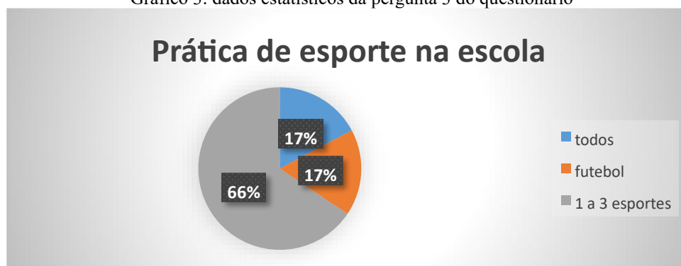
Gráfico 3: dados estatísticos da pergunta 3 do questionário

Também houve questionamento na pergunta 3 quanto a prática de esportes na escola e apresentados 4 modalidades: Futebol, Voleibol, Basquetebol, Handebol. Obteve-se o seguinte resultado: 17% praticavam todos (as 4 modalidades citadas), 17% só futebol e 66% praticavam de 1 a 3 esportes na escola. Mostrados abaixo, no gráfico 3.