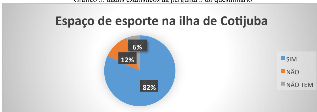
Gráfico 5: dados estatísticos da pergunta 5 do questionário

Quanto a conhecer os espaços de esporte na ilha de Cotijuba foram verificados que 82% dos educandos conhecem os espaços que são oferecidos na ilha para a prática esportiva, 12% não conhecem e 6% informaram que não tem espaço esportivo na comunidade.