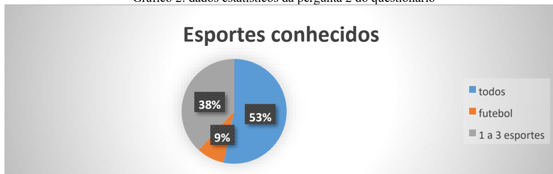
Gráfico 2: dados estatísticos da pergunta 2 do questionário

discentes conheciam todos os 4 citados, 38% conheciam de 1 a 3 desses esportes e 9% conheciam apenas o futebol.