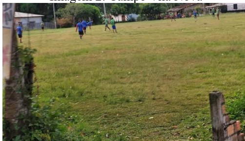
Imagem 2: Campo Vila Nova