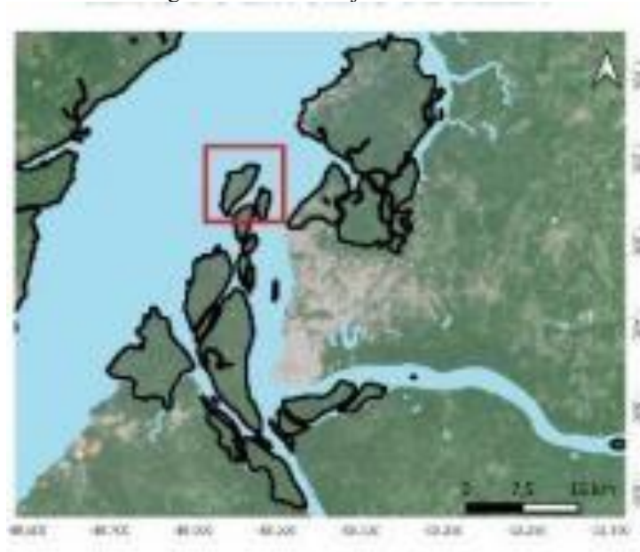
Figura 1: Ilha de Cotijuba – Belém/PA

A pesquisa foi realizada numa ilha que é de preservação ambiental desde 1990, chamada Cotijuba, fica localizada em Belém do Pará. Onde pode ser observada na figura 1 a localização da ilha, logo abaixo, a imagem foi adquirida no site da FAPESPA e adaptada para ilustração nessa pesquisa.