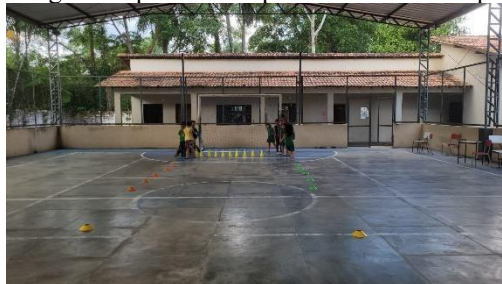
Imagem 1: quadra de esporte da escola Bosque

Em relação a melhoria dos espaços para a práticas de esporte na ilha citaram uma melhor iluminação, novos espaços para realização de esporte como uma quadra poliesportiva, marcação nos campos de futebol e de voleibol de areia e melhorar as ruas que dão acesso aos espaços onde se praticas esporte na ilha de Cotijuba.