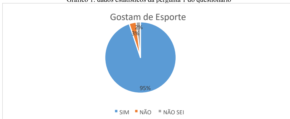
Gráfico 1: dados estatísticos da pergunta 1 do questionário

As perguntas de 1 a 5 são do tipo fechada e apresentam os gráficos com os resultados estatísticos das 5 primeiras questões. Na pergunta 1 do questionário os estudantes foram questionados se gostam de esporte e o gráfico 1 em formato de pizza, abaixo: obteve-se que 95% gostam de esporte e somente 3% não gostam e 2% não optaram.