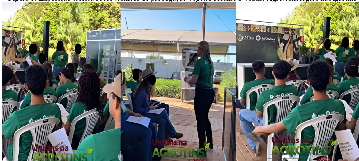
Figura 1: Exposição teórica sobre técnicas de propagação vegetal durante a Vitrine Agrotecnológica na Agrotins