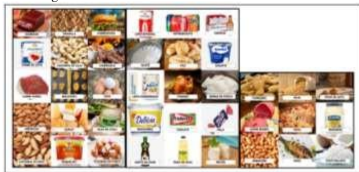
Figura 2 – Lista de alimentos distribuída aos alunos.

Na sequência foi entregue aos alunos uma lista de alimentos variados (Figura 2), e foi solicitado que os grupos identificassem o nutriente predominante (carboidratos, lipídeos ou proteínas) em cada alimento. Além disso, eles deveriam descrever dois critérios utilizados para a classificação proposta. Essa atividade foi planejada para despertar o engajamento dos alunos, incentivando-os a utilizar sua criatividade para estabelecer conexões entre os alimentos e seus componentes nutricionais e para reforçar o entendimento destes sobre os nutrientes e encorajá-los a explorar as nuances da composição nutricional dos alimentos. Além disso, a atividade também desafiava os alunos a estabelecerem conexões entre alimentos que, à primeira vista, poderiam parecer muito distintos, mas que compartilhavam a característica de possuir a mesma classe predominante de nutrientes.