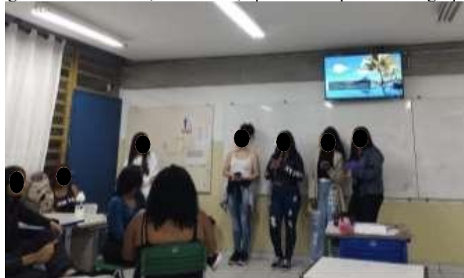
Figura 6 – Seminário, com slides, apresentado por um dos grupos.