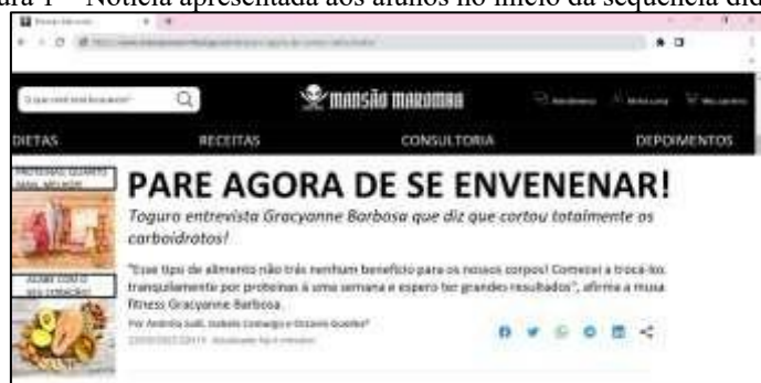
Figura 1 – Notícia apresentada aos alunos no início da sequência didática.