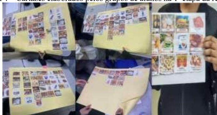
Figura 4 – Cartazes elaborados pelos grupos de alunos na 1ª etapa da regência.