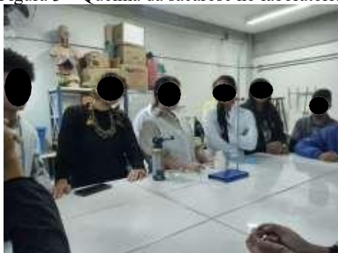
Figura 3 – Queima da sacarose no laboratório.