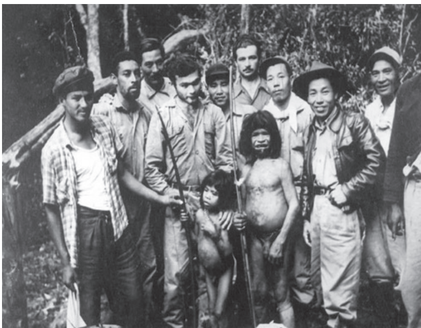
“Índios Xetás que habitavam a Serra dos Dourados”, reproduzido de Discover Nikkei (Miyamura, 2013).