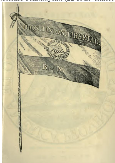
Figura 2. Bandeira das Províncias Unidas da América Central (1824) com o lema 'Dios, Unión, Libertad' / Flag of the United Provinces of Central America (1824) with the motto 'God, Union, Liberty' .

A bandeira da República Federal da América Central reflete os ideais centrais da federação, constituída após a independência da Espanha. A inscrição “Dios. Unión. Libertad.” (Deus. União. Liberdade.) simboliza os valores fundamentais defendidos pela República: a fé religiosa, a unidade entre os estados centro-americanos e a liberdade recém-conquistada do domínio colonial.