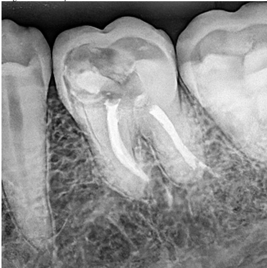
Figura 2 – Obturação do sistema de canais radiculares oela técnica do cone único