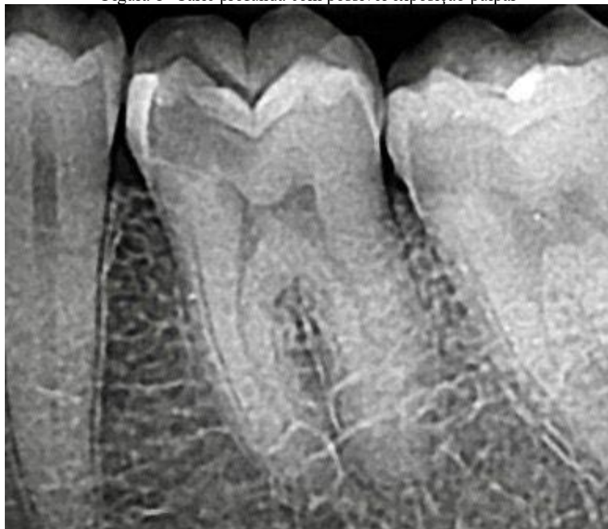
Figura 1 -Cárie profunda com possível exposição pulpar

Após a anestesia, o dente foi isolado e o acesso coronário foi realizado utilizando-se broca diamantada 1014 (KG Sorensen, Cotia, SP, Brasil). A irrigação foi realizada com Clorexidina a 2%. Após exploração do canal radicular, realizou-se a odontometria radiográfica.