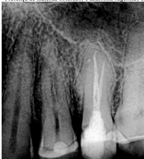
Figura 1 - Presença de material obturador e anatomia sugerindo canal extra

A desobturação do canal radicular foi realizada com o sistema rotatório Prodesign S da Easy (Fig.2) lima #25.08), acionado pelo motor da X-Smart (Dentsplay) com pequenos avanços e recuo, e pincelamento contra as paredes do canal radicular para melhor limpeza e remoção do material obturador. Não houve a necessidade de utilizar qualquer tipo de solvente no processo de desobturação. A cada 2 mm de avanço da lima rotatória, irrigava, aspirava e inundava se com hipoclorito de sódio (NaOCl) a 2,5%. A irrigação foi realizada com seringa plástica, Ultradent de 5 ml, com agulhas Navitip (Ultradent) demarcada com cursor stop. A odontometria foi feita com o localizador apical Root ZX, determinando o comprimento real do dente e foi confirmada com a radiografia. (Figura 2).