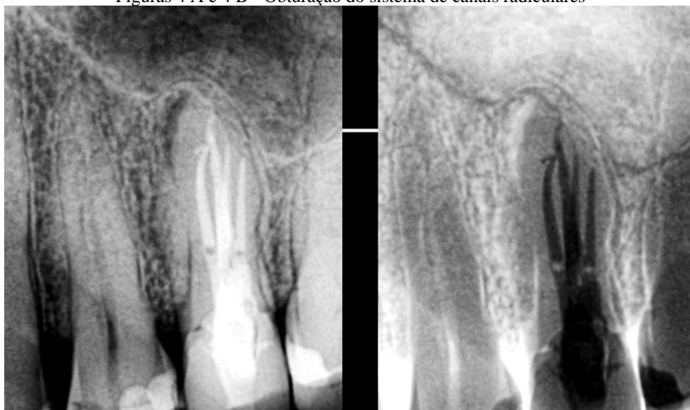
Figuras 4 A e 4 B - Obturação do sistema de canais radiculares

A secagem do canal radicular foi realizada com cones de papel absorventes estéreis 30#05, e a obturação do sistema de canais radiculares foi realizada pela técnica do cone único 30#05, associado ao cimento Bio C Sealer (Figuras 4 A e 4 B). A paciente encaminhada para o protesista.