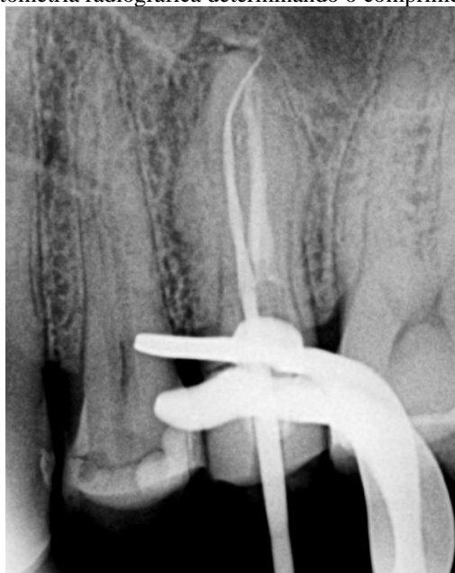
Figura 2 - Odontometria radiográfica determinando o comprimento real do dente

A patência foraminal foi executada com as limas 30#01 e o reparo do canal realizado com instrumentação rotatória (Sistema Prodesign Logic 2: lima 30#05, determinando-se uma ampliação e modelagem apropriada à anatomia do canal.