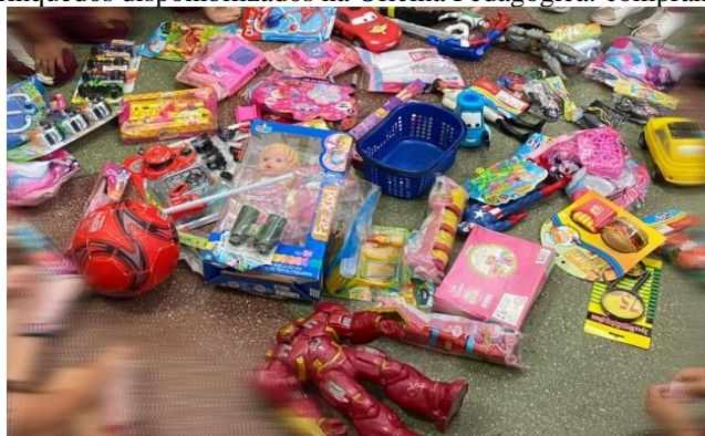
Figura 3 - Brinquedos disponibilizados na Oficina Pedagógica: comprando brinquedos

No terceiro momento da oficina pedagógica “Comprando brinquedos”, diversos brinquedos, novos e usados, foram disponibilizados no centro da sala (Figura 3), considerando as preferências das crianças, que poderiam brincar tanto individualmente quanto coletivamente. A euforia tomou conta do espaço enquanto as crianças manuseavam os brinquedos, abriam as embalagens e iniciavam interações espontâneas. Suas falas, como “tia, pode abrir o brinquedo?”, “vou levar para casa” e “pode escolher mais de um?”, constituíram os pré-indicadores, que foram agrupados em indicadores e transformados em núcleos de significação para a análise. A alegria das crianças foi evidente, refletindo seu encantamento com a atividade.