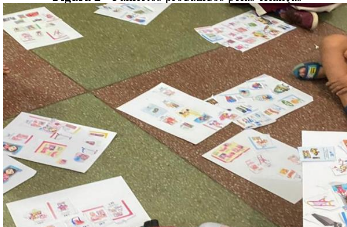
Figura 2 - Panfletos produzidos pelas crianças