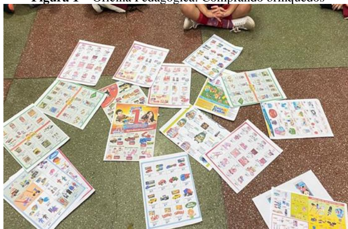
Figura 1 – Oficina Pedagógica: Comprando brinquedos

A oficina pedagógica “Comprando brinquedos” teve o objetivo de identificar as pedagogias de gênero e sexualidade a partir dos brinquedos e brincadeiras das crianças. Para a realização dessa oficina, as crianças foram convidadas a sentar no chão da sala de aula em círculo, quando foram apresentados alguns panfletos com imagens de brinquedos, como se observa na Figura 1, a seguir.