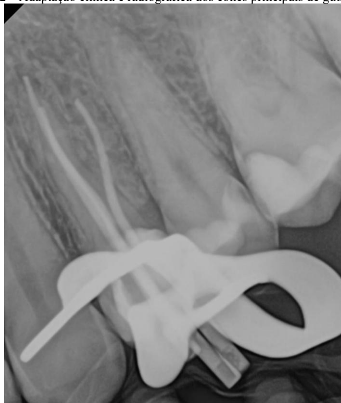
Figura 2 – Adaptação clínica e radiográfica dos cones principais de guta-percha.

A obturação do sistema de canais radiculares foi realizada pela técnica do cone único calibrado associado ao cimento o AH-Plus. O corte da guta-percha foi realizado com termo compactadora (WAK) 1mm abaixo das embocaduras e a compactação da guta-percha feita com condensadores de Shilder.