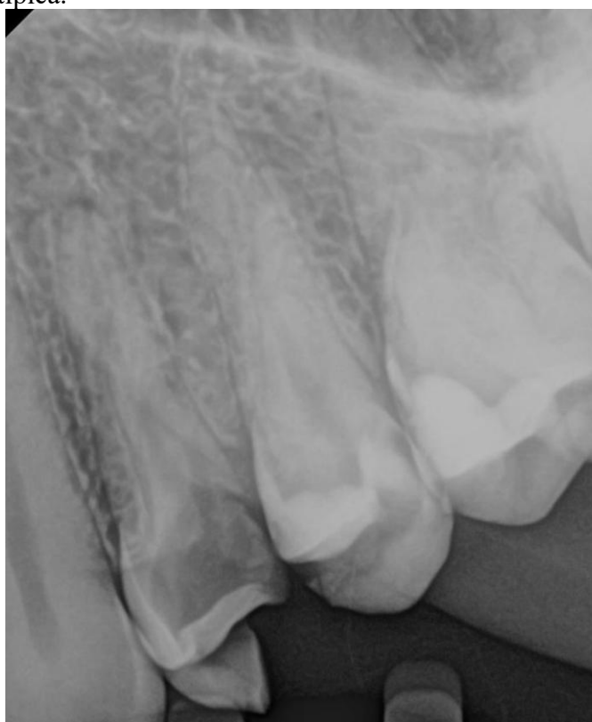
Figura 1 - Luz do canal apenas no terço cervical da raiz, o contorno dos ligamentos periodontais sugeria uma anatomia atípica.

No teste de sensibilidade pulpar ao frio, a paciente exibiu resposta positiva e exacerbada e não havia sintomatologia periapical (palpação e percussão). Após o diagnóstico de pulpíte irreversível, a