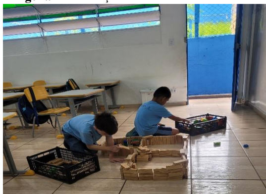
Figura 1 – Crianças brincando na sala de aula

Conforme já indicado, toda criança tem necessidade e o direito de brincar, ou seja, uma característica da infância garantida em lei. Desde o nascimento, as brincadeiras são fundamentais no desenvolvimento motor, cognitivo, social e afetivo de uma criança. No ambiente escolar, o brincar auxilia no processo de aprendizagem, promovendo a interação e a socialização entre as crianças. Não há dúvida de que os jogos e as brincadeiras infantis foram criados na história da humanidade pela cultura e se mantêm como práticas culturais extremamente interessantes para a criança.