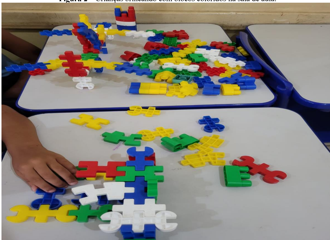
Figura 2 – Crianças brincando com blocos coloridos na sala de aula.

Assim, o ambiente também favorece a liberdade de movimento, permitindo que os alunos explorem o espaço e interajam com os materiais de forma autônoma. A imagem reforça a relevância de integrar atividades lúdicas ao processo educacional, promovendo tanto o aprendizado quanto o prazer em descobrir e criar.