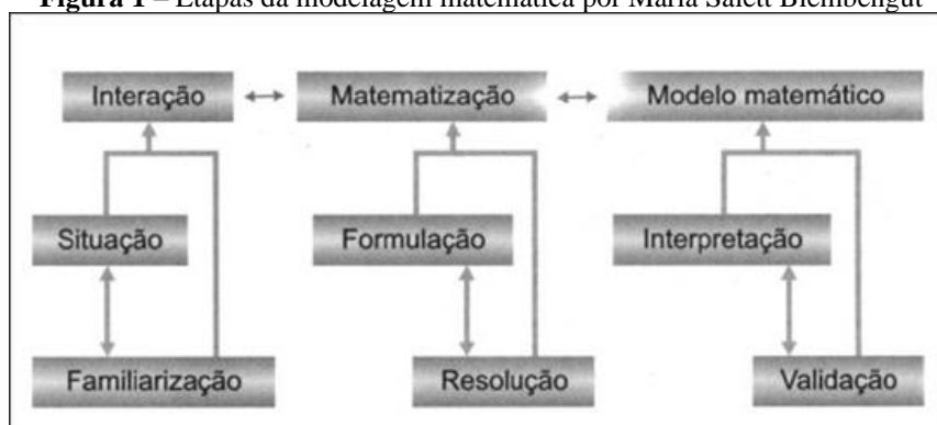
Figura 1 – Etapas da modelagem matemática por Maria Salett Biembengut

Tal processo conforme apresentado na Figura 1 e descrito no Quadro 2, pode ser desenvolvido em três etapas, subdivididas em seis subetapas, a saber: I - Interação: a) reconhecimento da situação-problema; b) familiarização com o assunto a ser modelado e o referencial teórico. II - Matematização: a) formulação do problema que leva a hipótese; b) resolução do problema em termos do modelo. III - Modelo Matemático: a) interpretação da solução; b) validação do modelo que leva a avaliação (Biembengut; Hein, 2018, p. 13).