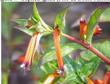
Figura 4- Cuphea ignea (Flor de Santo Antônio)