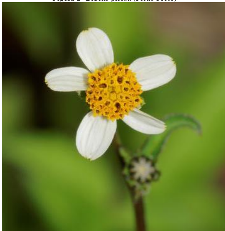
Figura 2- Bidens pilosa (Picão Preto)