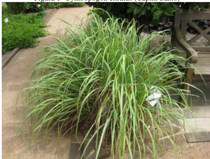
Figura 1- Cymbopogon citratus (Capim Santo)