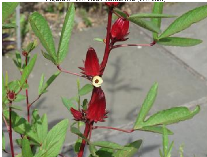
Figura 3- Hibiscus sabdariffa (Hibisco)