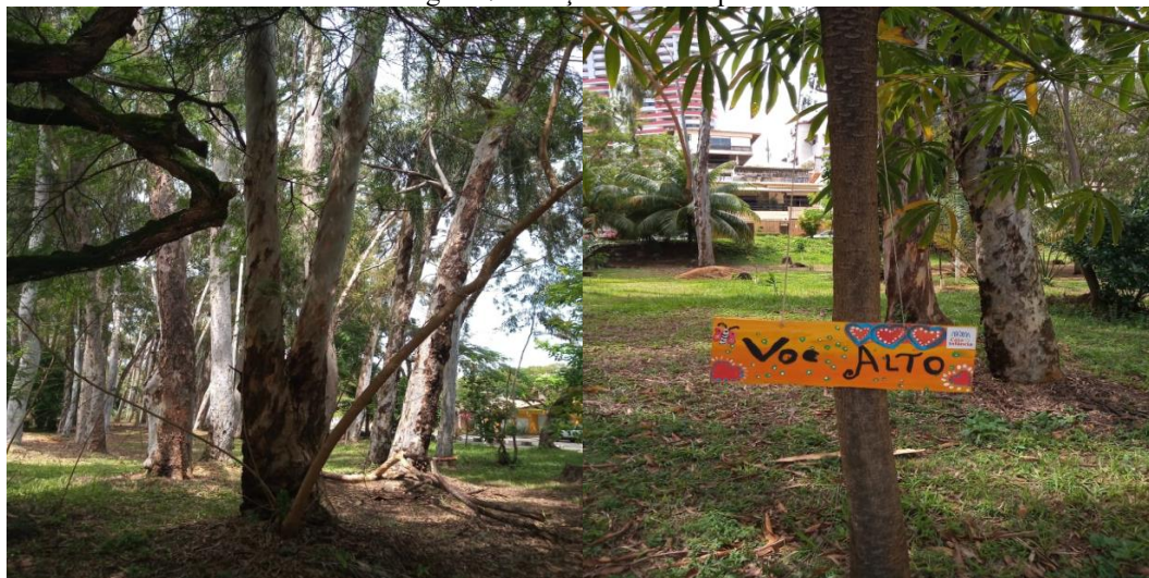
Figura 7 - Praça dos Eucaliptos