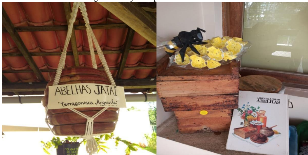
Figura 8 - Projeto “Aprenda a criar abelhas”