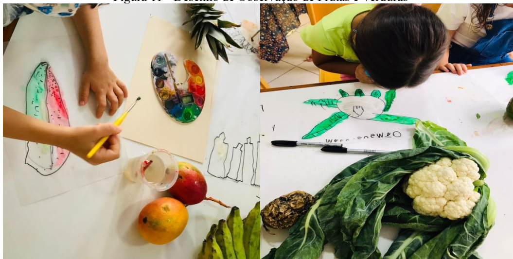
Figura 11 - Desenho de Observação de Frutas e Verduras