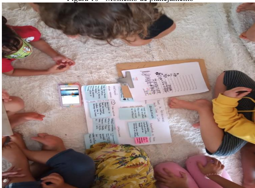
Figura 10 - Momento de planejamento