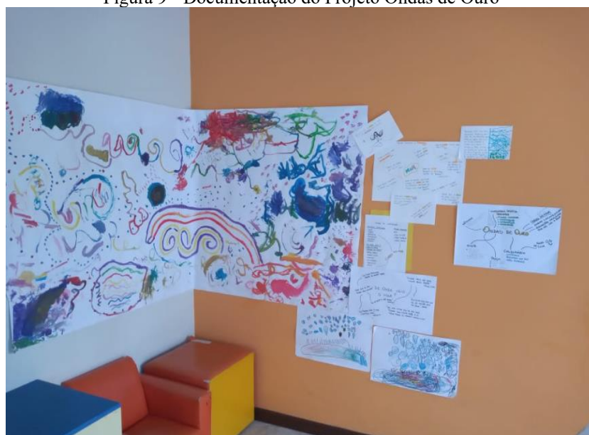
Figura 9 - Documentação do Projeto Ondas de Ouro