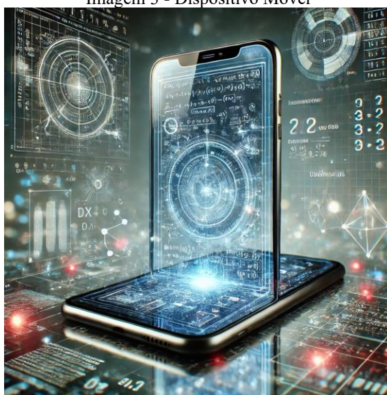
Imagem 3 - Dispositivo Móvel

de aula, restringindo o acesso a dispositivos com conexão à internet durante as aulas e intervalos. Essa restrição, embora justificada como uma tentativa de minimizar distrações, levanta questionamentos sobre como equilibrar o uso pedagógico dessas ferramentas e os riscos associados à sua utilização inadequada. Nesse sentido, Santos e Braga (2023) destacam que, quando mediada adequadamente, a aprendizagem por meio de dispositivos móveis pode promover o desenvolvimento de habilidades, como a leitura crítica e a resolução de problemas.