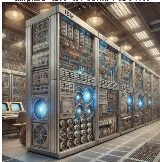
Imagem 2 - IBM 7030 'Stretch' e CDC 6600