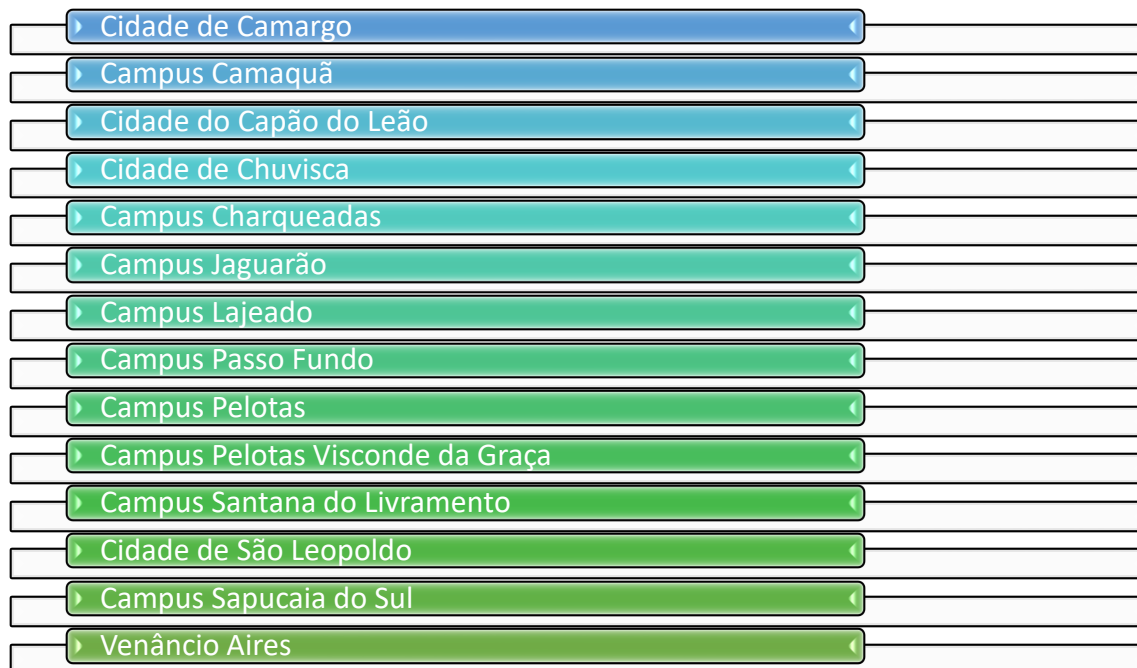
Figura 4 - Campus e Cidades ofertantes dos cursos de Formação Inicial e Continuada.

Os resultados obtidos pelo IFSul corroboram as diretrizes apresentadas ao longo do artigo, destacando a importância da formação contínua de docentes como um fator crítico para o sucesso da Educação de Jovens e Adultos. Estudos anteriores apontam que a capacitação de educadores não apenas melhora a qualidade do ensino, mas também influencia positivamente a permanência e o engajamento dos alunos (Freire, 2001).