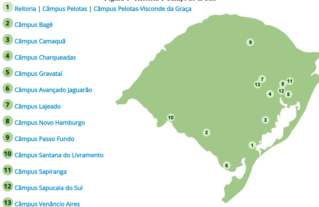
Figura 1- Reitoria e Campi do IFSul.

Dessa forma, este artigo buscou contribuir para o preenchimento dessas lacunas, ao analisar detalhadamente as experiências dos estudantes no PROEJA do IFSul, suas dificuldades, e as possíveis soluções institucionais para melhorar os índices de permanência e êxito.