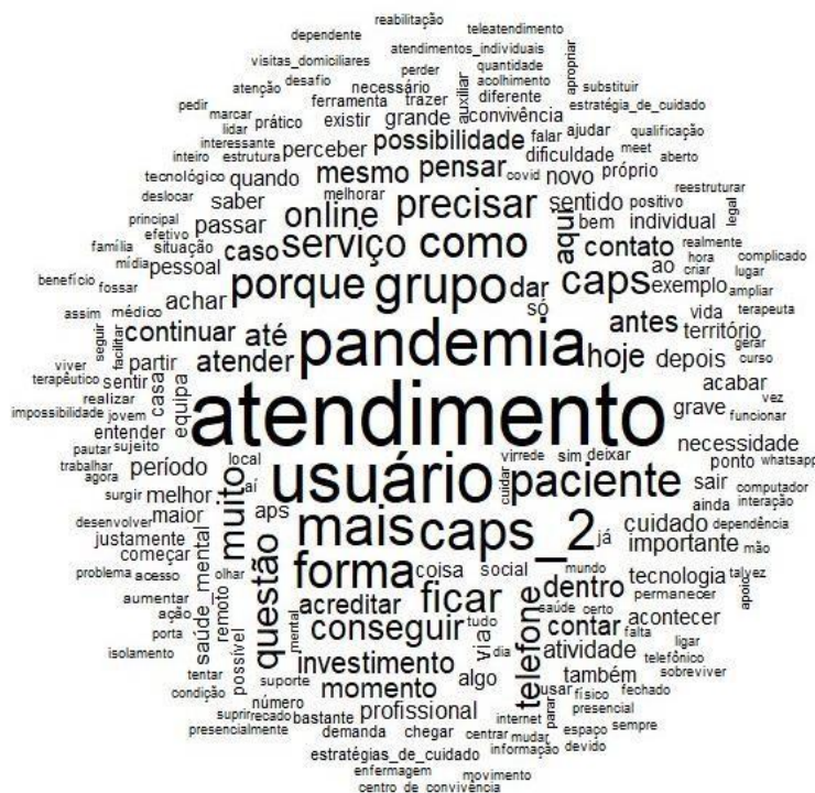
Figura 1 Nuvem de palavras