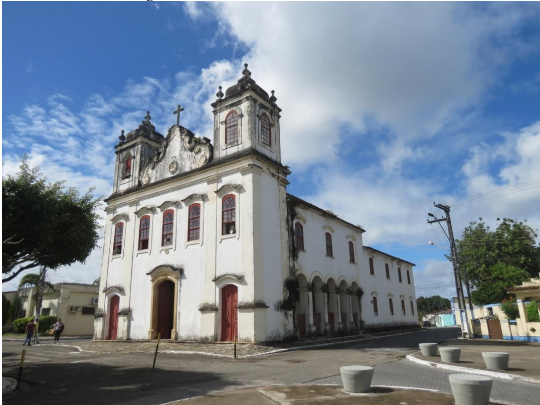
Figura 1 - Santuário Nossa Senhora Divina Pastora