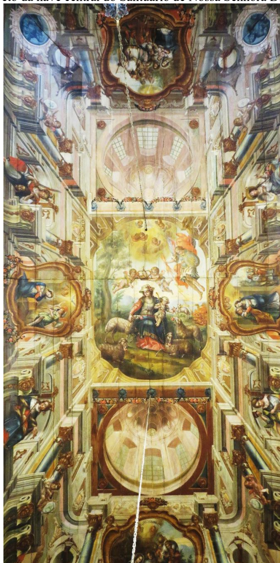
Figura 2 - Teto da nave central do Santuário de Nossa Senhora Divina Pastora