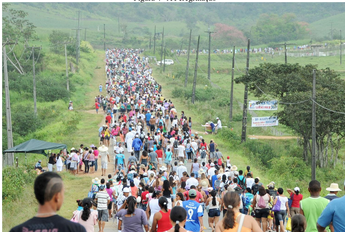
Figura 4— A Peregrinação