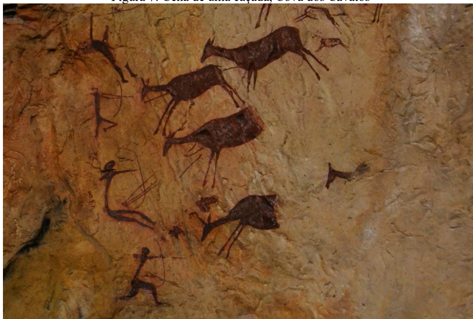
Figura 7: Cena de uma caçada, Cova dos Cavalos