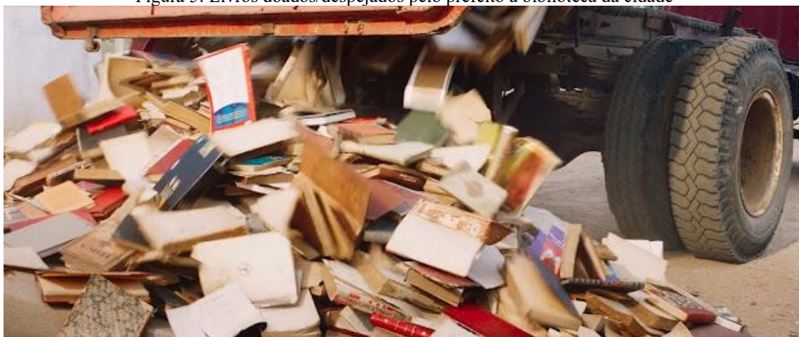
Figura 5: Livros doados/despejados pelo prefeito à biblioteca da cidade

No entanto, o prefeito demonstra sua impaciência pelo atrevimento daquela gente que, escondida para não vê-lo, grita de suas casas para que ele liberasse seu bem mais precioso: a água. Apesar das dificuldades, eles têm consciência do jogo político, e é, exatamente, isso que incomoda o “coronel” da região que não consegue enxergar submissão e gratidão naquelas pessoas.