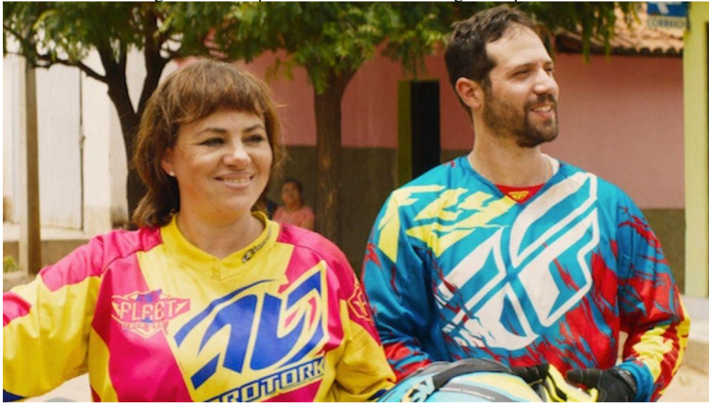
Figura 6: Motoqueiros desconhecidos chegam ao povoado