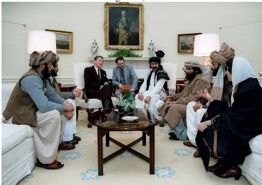
Figura 2: O presidente Reagan reunindo-se com mujahidins afegãos na Casa Branca para discutir a invasão soviética do Afeganistão, 1983