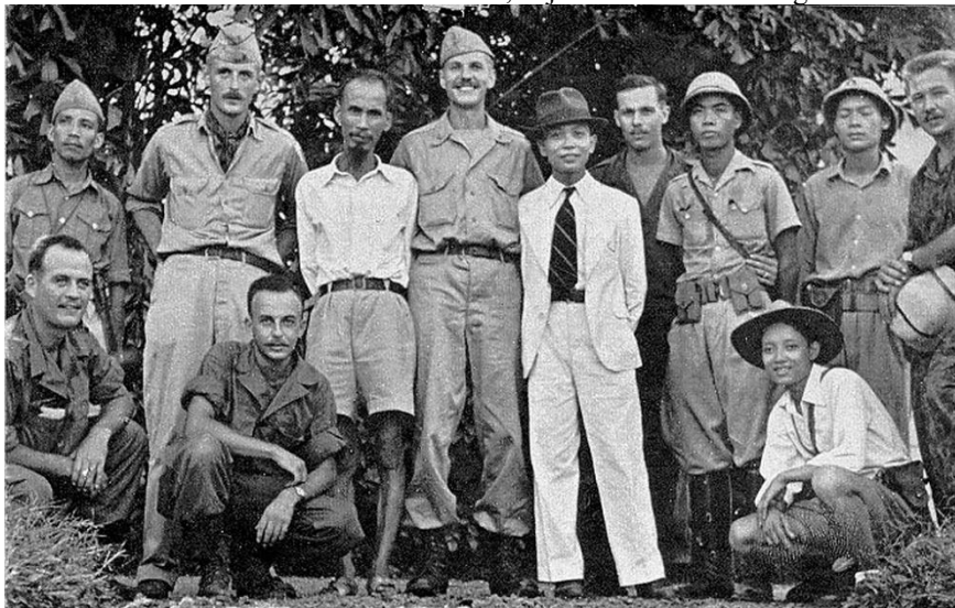
Figura 1: Ho Chi Minh com membros da OSS estadunidense, cuja missão era treinar guerrilheiros do Viet Minh, 1945

Fonte: National Archives and Records Administration