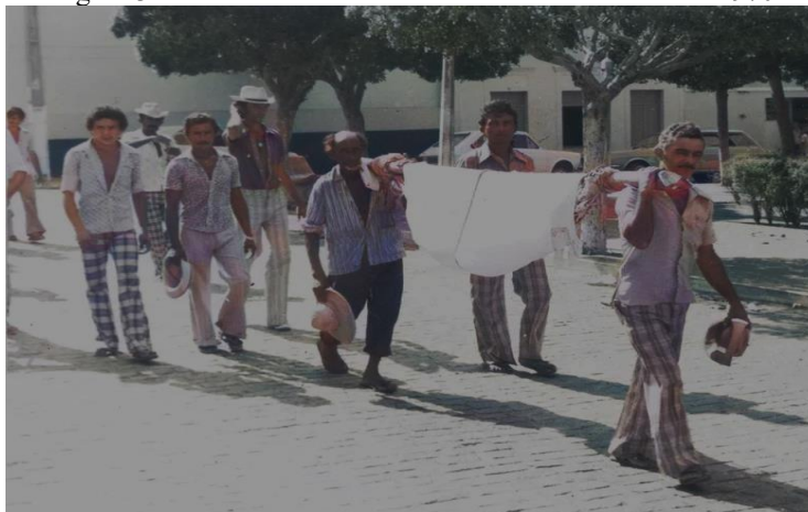
Figura 3: Enterro em rede no interior do Brasil nos anos 1970

Tais cenas rompem, de certa maneira, com ideias estereotipadas e propagadas, de modo especial, pela televisão que insiste em perpetuar uma visão simplista e preconceituosa da região. Ao focar apenas na pobreza, na seca, na fome, na miséria, tais mídias não só moldaram, de uma maneira pejorativa e caricata, o acervo iconofotológico de parte do país, como também reforçaram a ideia de desventura absoluta na região. Nesta se encontram apenas retirantes em desespero, cercados de cortejos fúnebres, cujos mortos são carregados em redes 6 (fig. 3), acompanhados de gente letárgica, fraca e ingênuo. No entanto, tal construção mascara diversas outras características resilientes dessa gente que não se entrega, tão facilmente, à hostilidade do local.