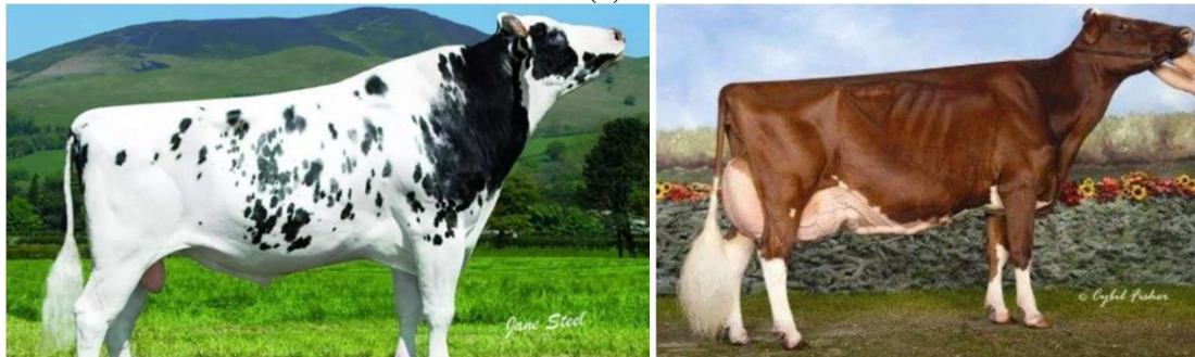
Figura 1. Touro da raça Holandesa de pelagem preta e branca (a); vaca de pelagem vermelha e branca da raça Holandesa (b).