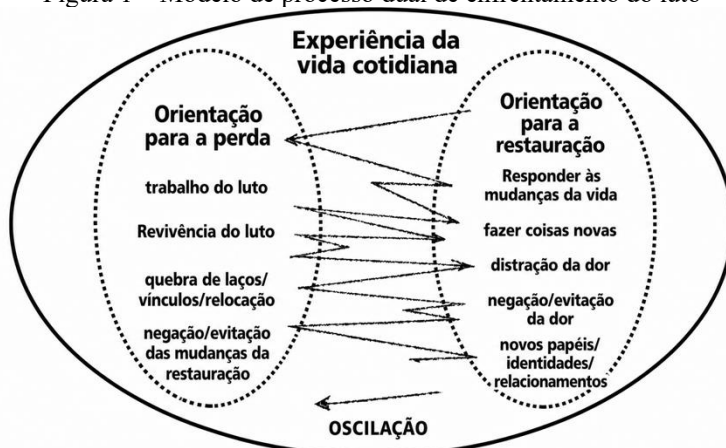
Figura 1 – Modelo de processo dual de enfrentamento do luto