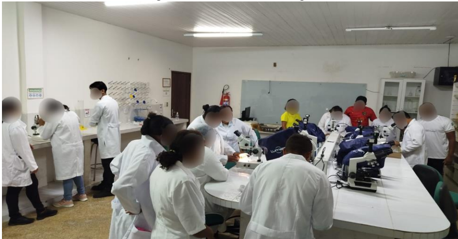
Figura 1. Oficina de microscopia.

Durante a atividade, verificou-se que muitos estudantes demonstraram entusiasmo ao visualizar, pela primeira vez, estruturas microscópicas, o que evidencia a relevância de estratégias didáticas que tornam os conteúdos abstratos mais concretos e acessíveis. Esse resultado indica que a aproximação entre teoria e prática favorece não apenas a compreensão dos conteúdos, mas também o envolvimento emocional e cognitivo dos educandos com o processo de aprendizagem.