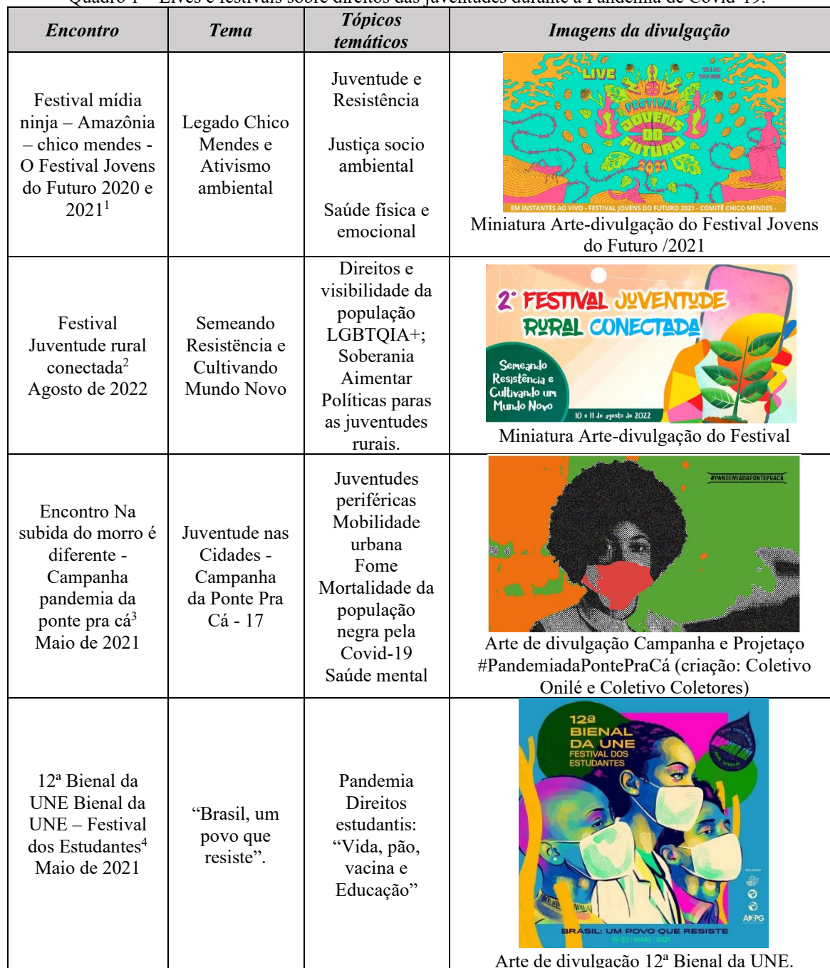
Quadro 1 – Lives e festivais sobre direitos das juventudes durante a Pandemia de Covid-19.