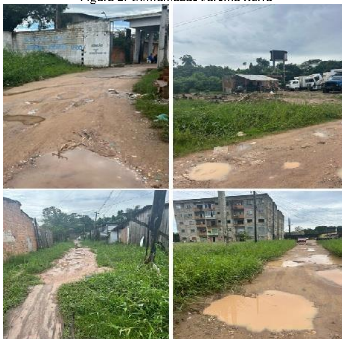
Figura 2. Comunidade Jurema Barra

A Comunidade Jurema Barra, localizada no Bairro Levilândia em Ananindeua, no estado do Pará, é um exemplo significativo de como as comunidades urbanas se desenvolvem em contextos de desigualdade social, econômica e espacial. O histórico dessa comunidade reflete uma série de transformações sociais, políticas e econômicas que marcaram a região ao longo das últimas décadas (Alencar, 2017)