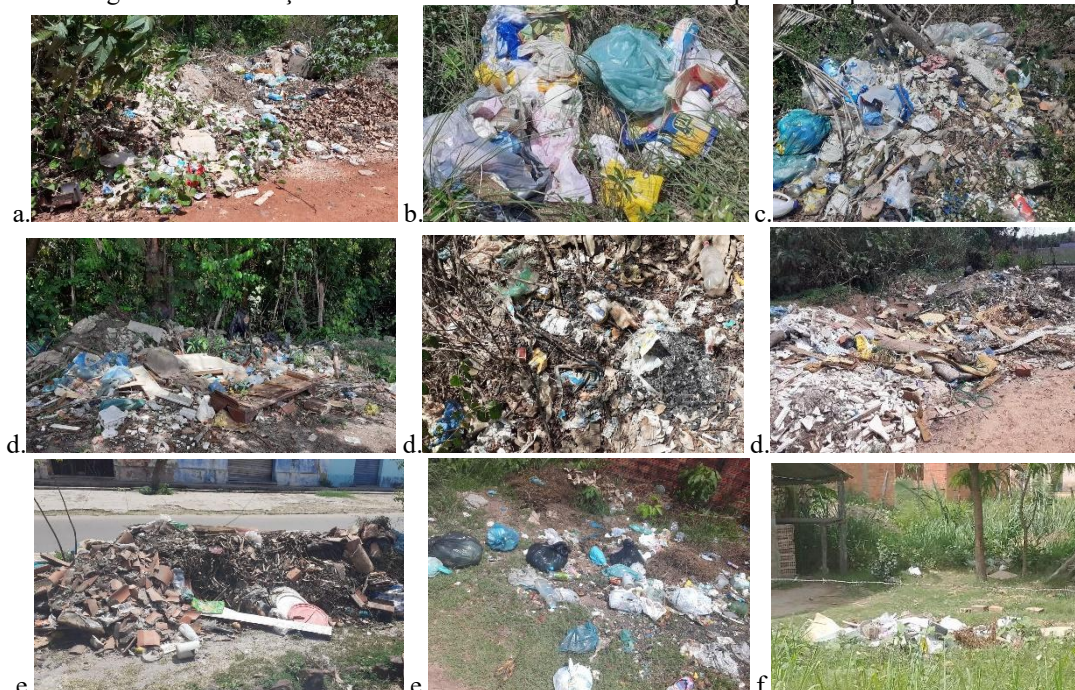
Figura 2: Distribuição de lixo em diferentes locais no município de Chapadinha – MA.

Locais verificados: a. Em Frente ao Cemitério na Área da UFMA; b. Em frente ao Condomínio Universitário no Parque Universitário; c. Ao Lado da Caixa D'água no Mutirão; d. 3 Pontos Diferentes de Lixo na Estrada de Terra ao Fundo do Bairro Esplanada; e. Lixo Amontoado em Via Pública na Av. Gustavo Barbosa; f. Lixo Acumulado no Fundo de uma Residência no Bairro Liberdade Onde Não Ocorre a Coleta.