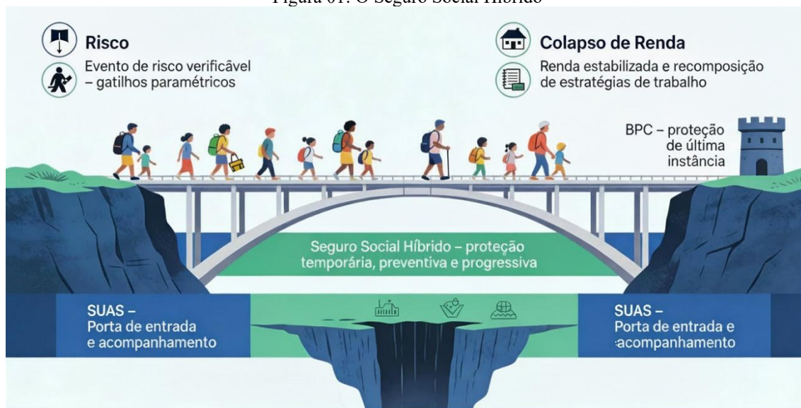
Figura 01: O Seguro Social Híbrido