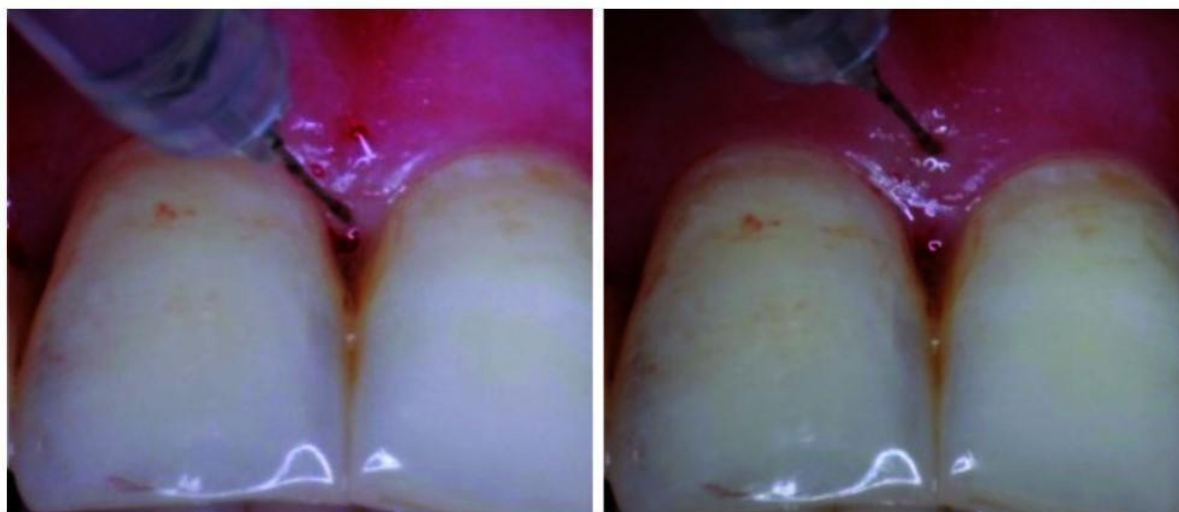
Figura 1: Locais de injeção de ácido hialurônico (HA)

No dia da injeção, os pacientes foram orientados a não escovar ou passar fio dental na região da injeção. Eles foram autorizados a escovar a área coronal da gengiva no dia seguinte, mas o uso do fio dental não foi permitido até duas semanas após a última injeção 13 .