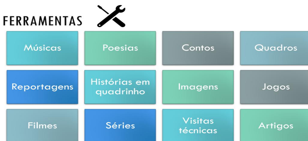
Figura 1. Ferramentas Motivacionais.

Portanto, as metodologias ativas são recursos de apoio pedagógico flexíveis, que podem variar conforme as intenções dos docentes e o contexto educacional. Nos planos analisados, identificou-se que os professores as utilizam como estratégia para organizar sequências de ensino que incentivam o envolvimento dos estudantes, combinando abordagens diversificadas que vão desde atividades práticas e cooperativas até o uso de ferramentas motivacionais, como músicas, vídeos e jogos. Isso pode materializar-se em produtos de aprendizagem, refletindo, criatividade, inovação, retenção e compreensão dos conteúdos, tais como peças literárias, maquetes, vídeos, apresentações, mapas conceituais, entre outros (Pereira, 2025).