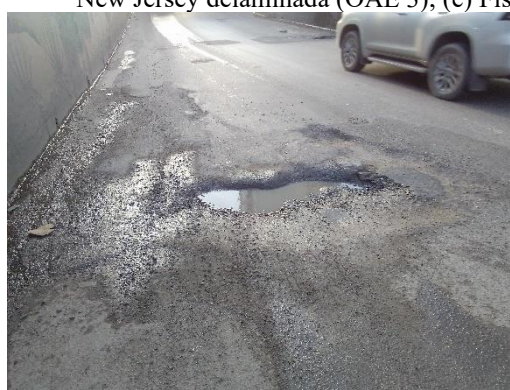
Mau remendo e/ou painéis