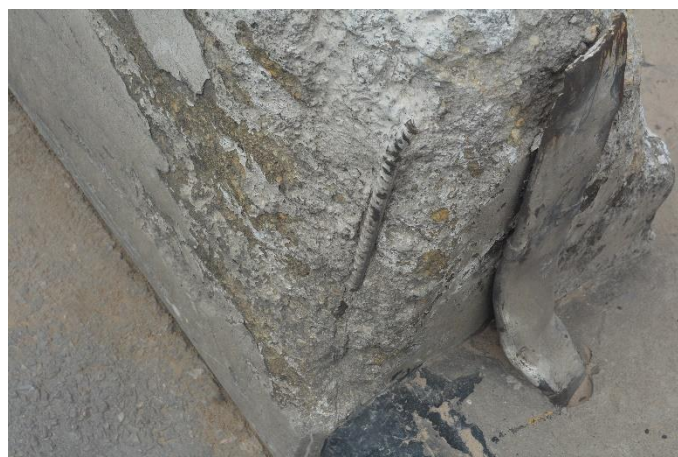
(d) Barreira New Jersey delaminada (OAE 3)