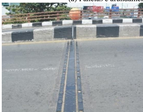
Ausência de alvéolos de fixação e fenda no remate entre a junta e acamada de transição