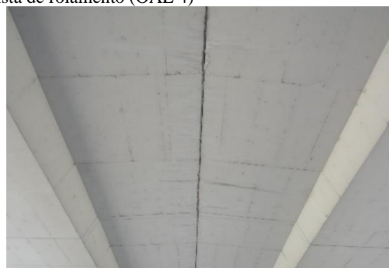
Escorrência de água pluvial