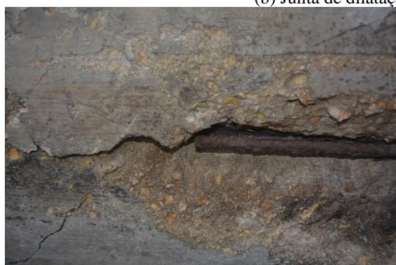
Exposição e corrosão das armaduras