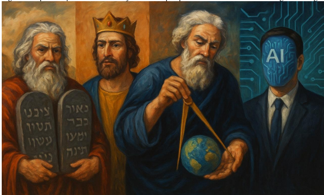
Figura 1. Representação simbólica da trajetória do arquétipo criador: de Moisés ao Demiurgo Tecnológico