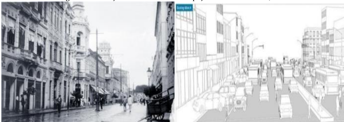
Figura 03 – Relações dos indivíduos nos espaços abertos – Salvador, 1890.