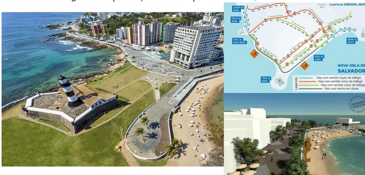
Figura 10 - Representação de Rua Compartilhada da Barra, Salvador Bahia

Esta rua apresenta um tratamento de superfície padronizado e diferenciado para fornecer indicações visuais; utiliza blocos de cimento intertravado; reduz a importância das calçadas para estimular os pedestres a circularem livremente por toda a rua, com todos os modos de transporte no mesmo nível, sendo separados apenas por limitadores de velocidade, balizadores e paisagismo; e inclui a presença de mobiliário urbano e arborização que permitem a apropriação do espaço. Além disso, há locais estratégicos de estacionamento e fachadas das edificações voltadas para a rua.