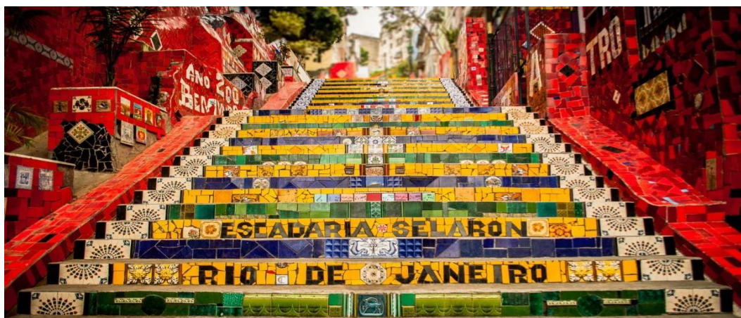
Figura 06 - Exemplos de arte pública em ruas - Escadaria Selaron, Rio de Janeiro, Brasil. Obra de Jorge Selaron inaugurada em 2013.

Essas manifestações artísticas no espaço público criam oportunidades para a interação social, tornando ruas, praças e parques em palcos de convivência e troca cultural. Elas também têm um impacto significativo na revitalização urbana, requalificando áreas degradadas e promovendo um sentimento de pertencimento e orgulho entre os moradores.