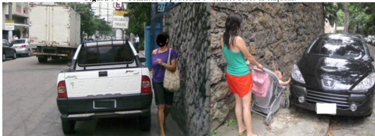
Figura 04 – Conflitos de pedestres e veículos sobre as calçadas.

Com a mudança no ciclo de socialização e nos valores públicos e privados, houve o abandono de espaços livres como praças e parques. As ruas foram projetadas para veículos, gerando conflitos entre a circulação de carros e pessoas e comprometendo a segurança. Com o tempo, a saturação de carros e os altos custos de manutenção tornaram essas vias insustentáveis, levando à valorização do pedestre a partir da segunda metade do século XX. Intervenções urbanas, como a requalificação de espaços públicos e projetos de mobilidade sustentável, têm melhorado a qualidade de vida, reduzido a pegada de carbono, promovido a integração social e estimulado a economia local. Assim, a valorização do espaço público é essencial para criar cidades mais resilientes e adaptáveis.