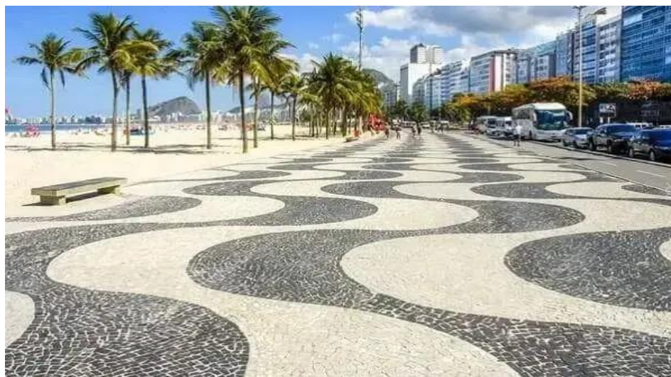
Figura 11 - Calçada em Pedras Portuguesas - Rio de Janeiro, RJ e vista superior da calçada

Esse contraste é particularmente evidente quando comparamos essas novas intervenções com a tradicional utilização das pedras portuguesas, um elemento arquitetônico popularizado pelos arquitetos baianos. As pedras portuguesas são conhecidas por suas formas e desenhos que são melhor apreciados à medida que se caminha sobre elas, valorizando a experiência do transeunte.