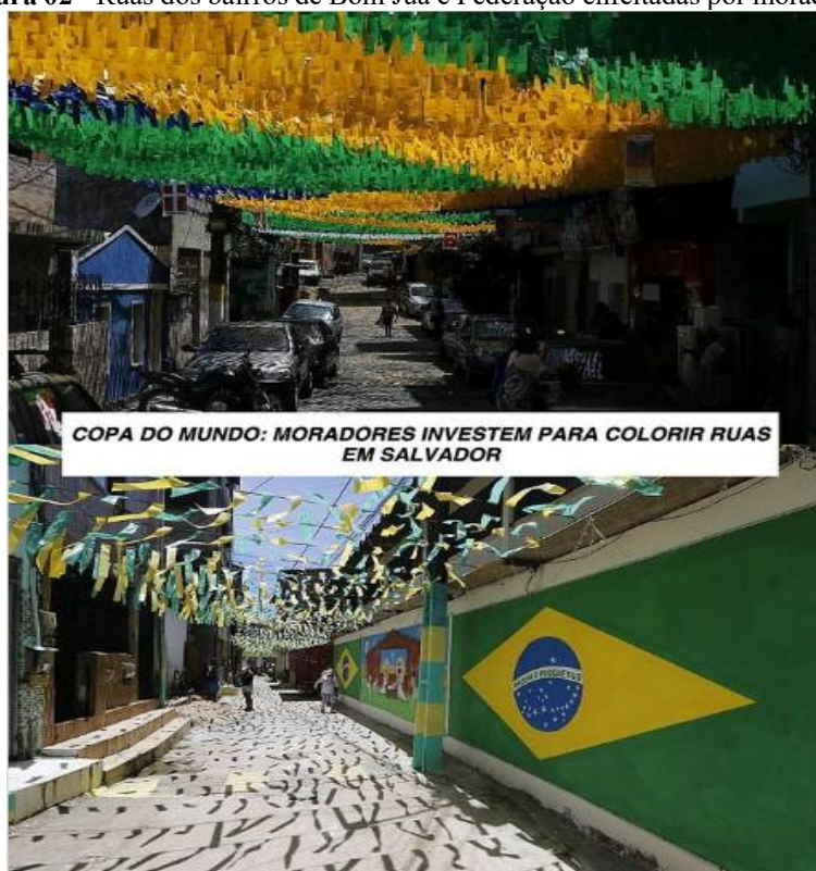
Figura 02 - Ruas dos bairros de Bom Juá e Federação enfeitadas por moradores.

Fonte: G1. Rua decorada em Macaíba, na Grande Natal.