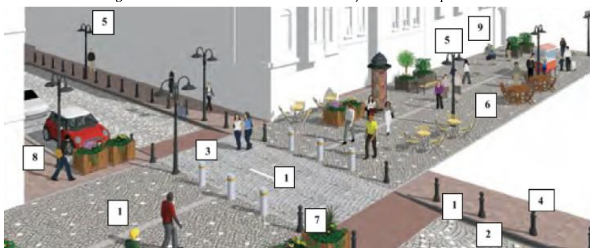
Figura 05 - Critérios mais utilizados na avaliação de ruas compartilhadas