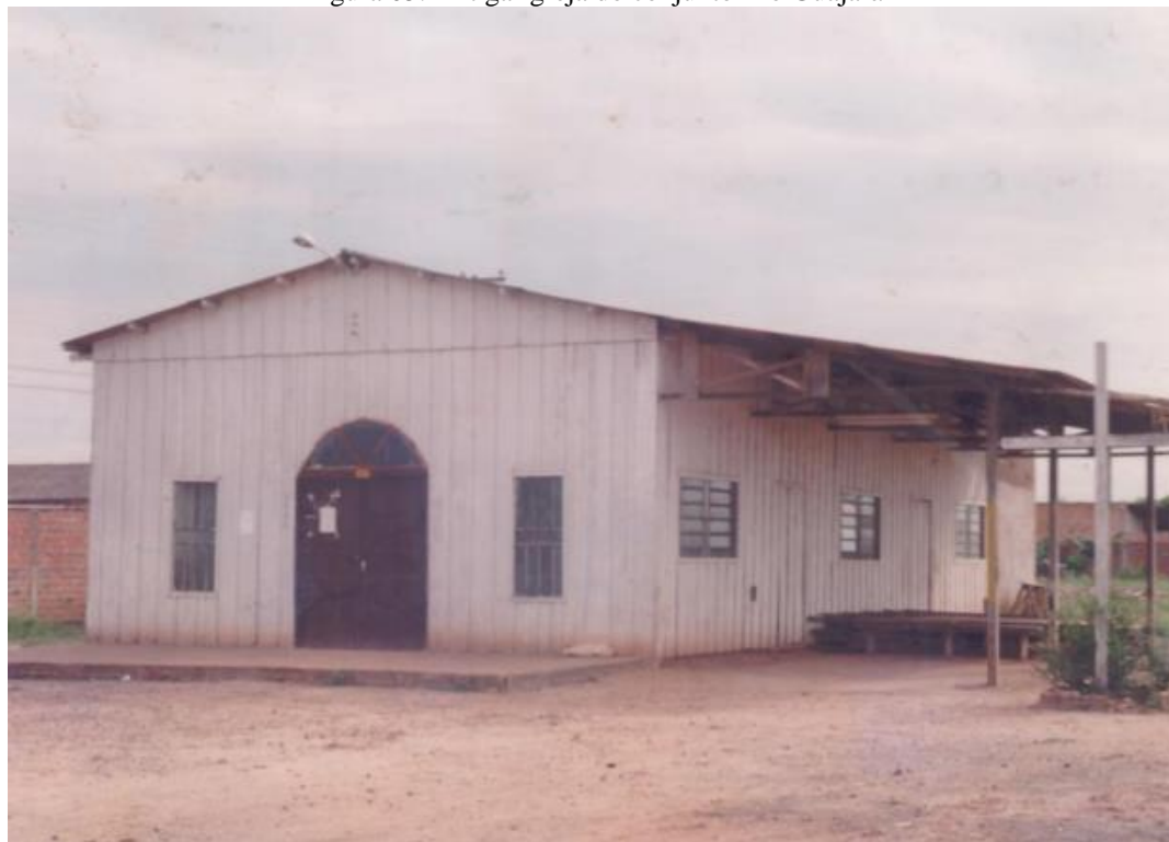
Figura 05. Antiga Igreja do conjunto Rio Guajará