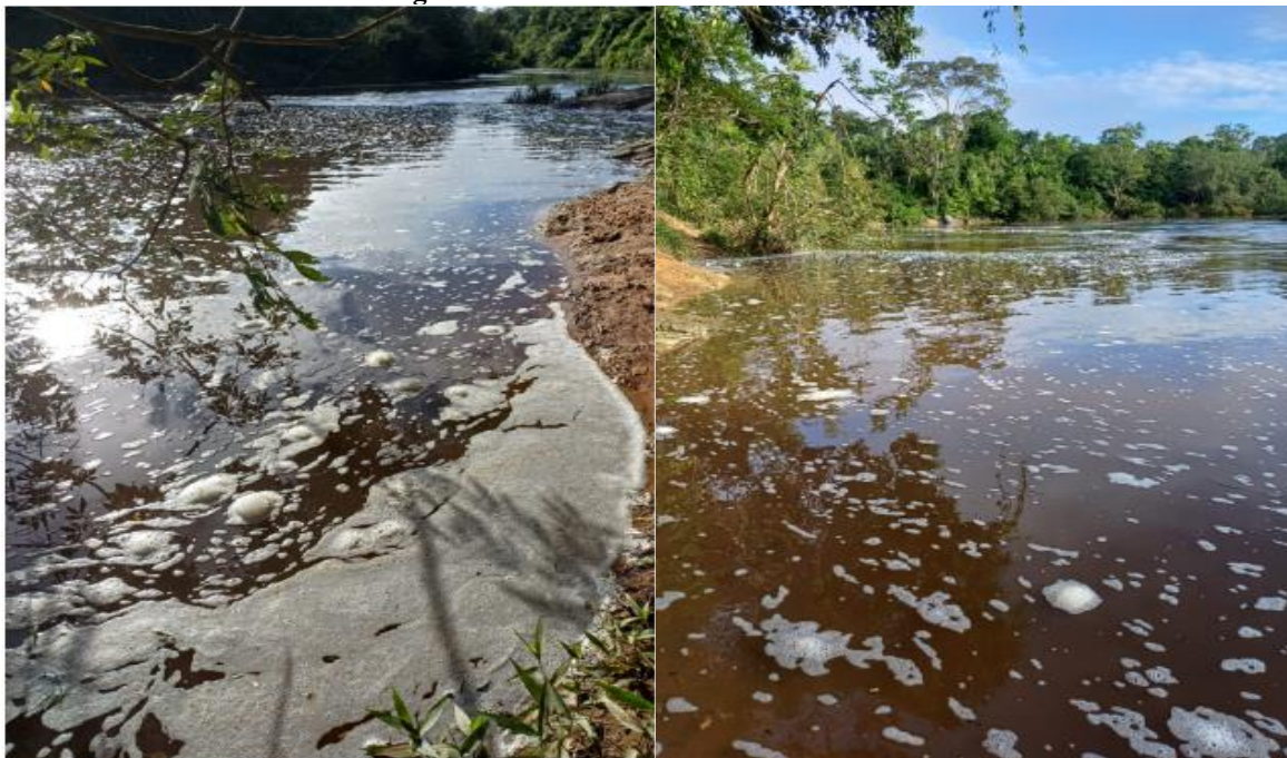
Figura 2 e 3- Porto da Aldeia Xikrin Cateté

Dos resultados obtidos, em todas as estações amostradas deram abaixo do limite para a concentração em águas superficiais e acima do limite para quantidades de cádmio em valores do parâmetro limiar, no qual há menor probabilidade de ocorrência de efeitos adversos à biota.