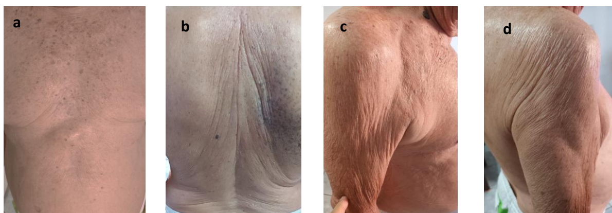
Figuras 03a, b, c e d. Regiões afetadas pelas lesões após 07 dias de uso dos florais. Remissão total das lesões.

Após uma semana de uso dos florais frequenciais Oxyflower® Gel e do Mydrix®, onde se constatou a regressão total das lesões e cessação completa do prurido, o mais notável foi a ausência de recidiva das lesões durante os sessenta (60) dias de tratamento até o presente momento, tendo se passado seis (06) meses, o que nunca havia ocorrido anteriormente.