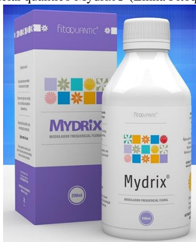
Figura 04. Floral frequencial quântico Mydrix® (Linha Fitoquantic - Fisioquantic S/A)

Durante esse período, o paciente não precisou recorrer ao uso de pomadas dermatológicas convencionais e relatou retomada do convívio social e familiar. Não foram observados efeitos adversos durante ou após o uso dos florais. Durante todo o tratamento, e após 06 meses, o paciente também fez uso de um suplemento nutricional, contendo Vitamina A, complexo B, C, D, K2 e vários minerais importantes às funções orgânicas, como zinco, magnésio, selênio, iodo, manganês e cálcio ( Totallis® – Catalmedic Indústria de Suplementação Alimentar Ltda – Maringá – PR, Brasil).