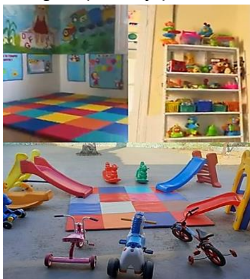
Figura 1 Organização do espaço interno e externo

Mesmo que o brinquedo pareça não ter uma função definitiva, quando a criança o manipula livremente sem estar preso a regras impostas por adultos ou a modelos de utilização “podemos dizer que a função do brinquedo é a brincadeira” (Brougère, 2008, p. 3). Concordamos com Vygotsky (1994) quando diz que durante a brincadeira “a criança se comporta além do comportamento habitual de sua idade, além de seu comportamento diário; no brinquedo, é como se ela fosse maior do que ela é na realidade” (p. 117).