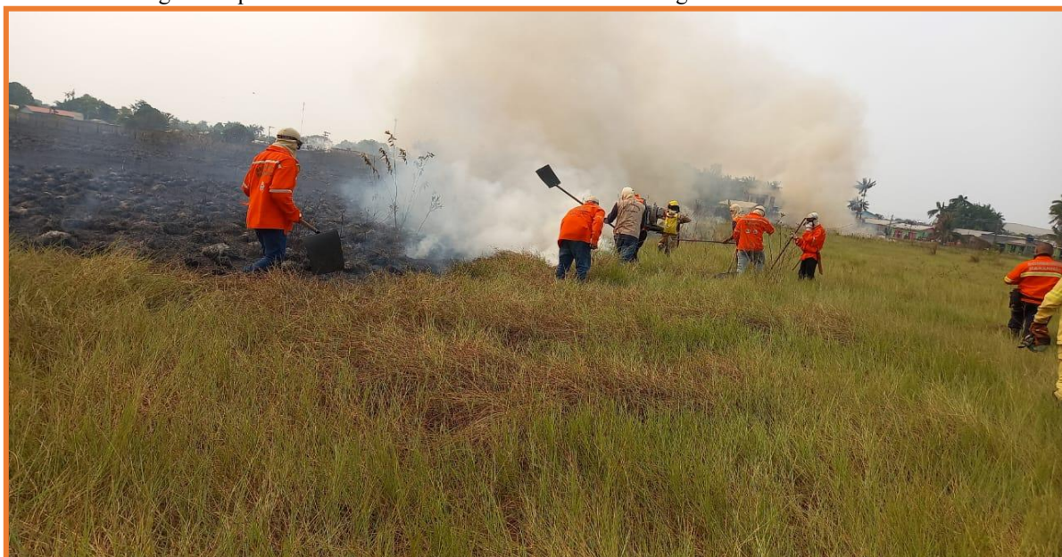
Figura 1: queimadas Bairro Pantanal / Bairro novo. Fotografia de setembro de 2024

A seguir são apresentada foto que ilustram as práticas de queimadas no município de Lábrea no ano de 2024 entre o perímetro urbano e a zona rural ao entorno da cidade: