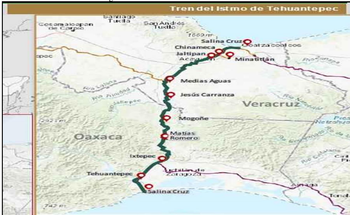
Figura 1: Corredor Interoceânico do México