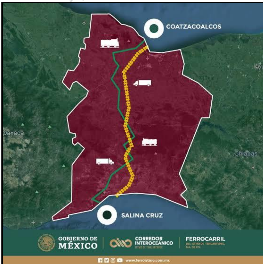
Figura 3: Corredor Transístmico e a Faixa Transístmica