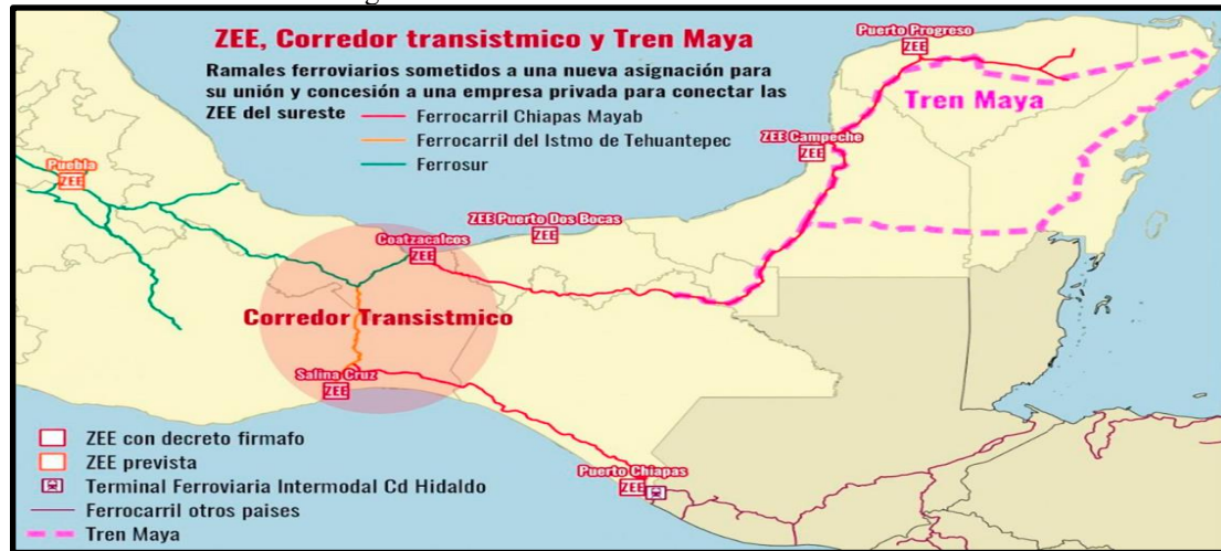
Figura 2: Corredor Transistmico e o Trem Maia