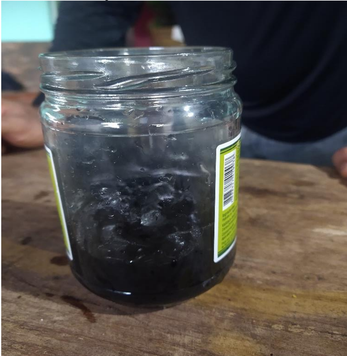
Figura 3: Mistura do carvão mineral e álcool 70.

sucussões). Assim, foi feita a homeopatia CH1, que foi utilizada para produzir o remédio em CH2 e assim sucessivamente até CH30.