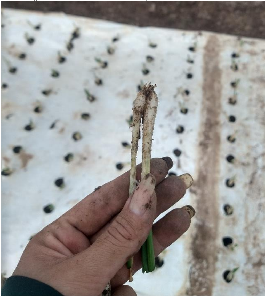
Figura 2: Muda da cebolinha com 2 bulbos, corte das mudas entre 5 a 10 cm.

necessidade de flexibilidade nas táticas de manejo, permitindo uma resposta eficaz e oportuna às condições reais do ambiente.