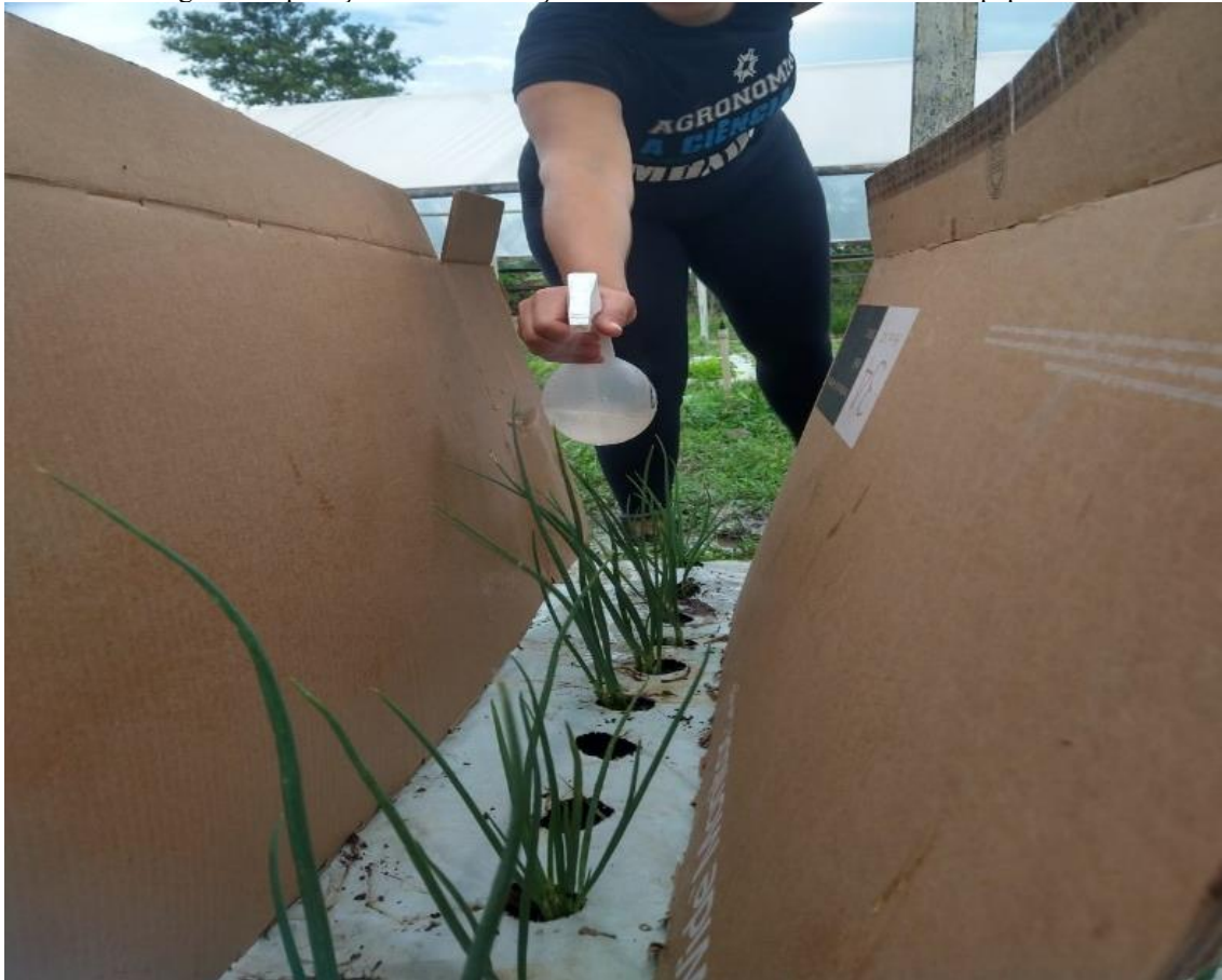
Figura 4: Aplicação das dinamizações na cultura com o uso da folha de papelão.