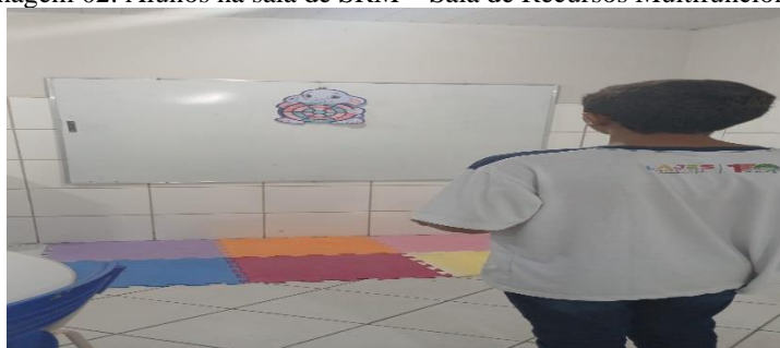
Imagem 02: Alunos na sala de SRM – Sala de Recursos Multifuncional.

A sala do AEE é um espaço onde atua diretamente com as necessidades específicas dos alunos, o mesmo são atendidos no contraturno da escola onde há seu planejamento, PAEE – Plano de Atendimento Educacional Especializado para atender de forma complementar e ou suplementar.