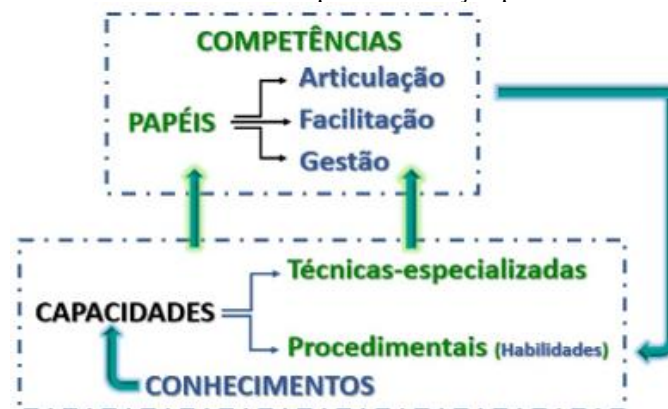
Figura 3. Abordagem orientadora do desenvolvimento do perfil de atuação profissional do agente de inovação social.

A Figura 3 apresenta uma abordagem orientadora que indica as inter-relações entre conhecimentos, habilidades e competências e como esses três conceitos se articulam para dar suporte ao desenvolvimento do perfil de atuação profissional do agente de inovação social. A Figura 3 também sinaliza que os conhecimentos são a base para a produção de capacidades (técnicas-especializadas e/ou procedimentais) que, por conseguinte, geram competências que ampliam as habilidades e dão mais condições de o agente de inovação social desempenhar seus papéis dentro do perfil desejado.