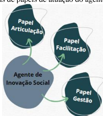
Figura 2. Categorias de papéis de atuação do agente de inovação social

Para se definir o perfil de atuação profissional do agente de inovação social, partiu-se da lógica até aqui exposta, oriunda da análise e abstração críticas dos documentos, correspondentes à segunda fase da metodologia. Desta fase resultaram três importantes categorias de papéis, representadas pela Figura 2, a seguir.