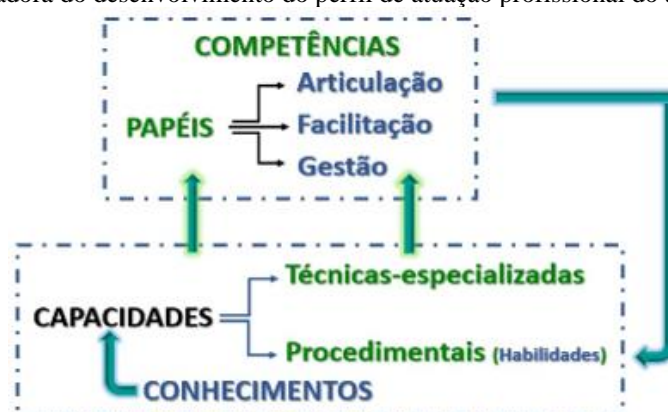
Figura 3. Abordagem orientadora do desenvolvimento do perfil de atuação profissional do agente de inovação social.

A Figura 3 apresenta uma abordagem orientadora que indica as inter-relações entre conhecimentos, habilidades e competências e como esses três conceitos se articulam para dar suporte ao desenvolvimento do perfil de atuação profissional do agente de inovação social. A Figura 3 também sinaliza que os conhecimentos são a base para a produção de capacidades (técnicas-especializadas e/ou procedimentais) que, por conseguinte, geram competências que ampliam as habilidades e dão mais condições de o agente de inovação social desempenhar seus papéis dentro do perfil desejado.