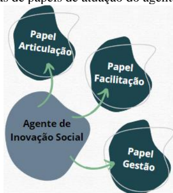
Figura 2. Categorias de papéis de atuação do agente de inovação social

Para se definir o perfil de atuação profissional do agente de inovação social, partiu-se da lógica até aqui exposta, oriunda da análise e abstração críticas dos documentos, correspondentes à segunda fase da metodologia. Desta fase resultaram três importantes categorias de papéis, representadas pela Figura 2, a seguir.