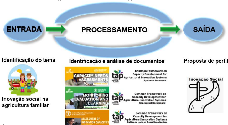
Figura 1. Modelo metodológico do trabalho.

possível criar três categorias de papéis: articulação, facilitação e gestão, cujas atribuições são consideradas fundamentais para o exercício da função de agente de inovação social.