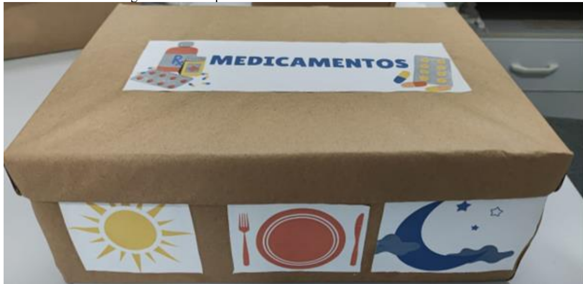
Imagem1 :Caixa separadora de medicamento