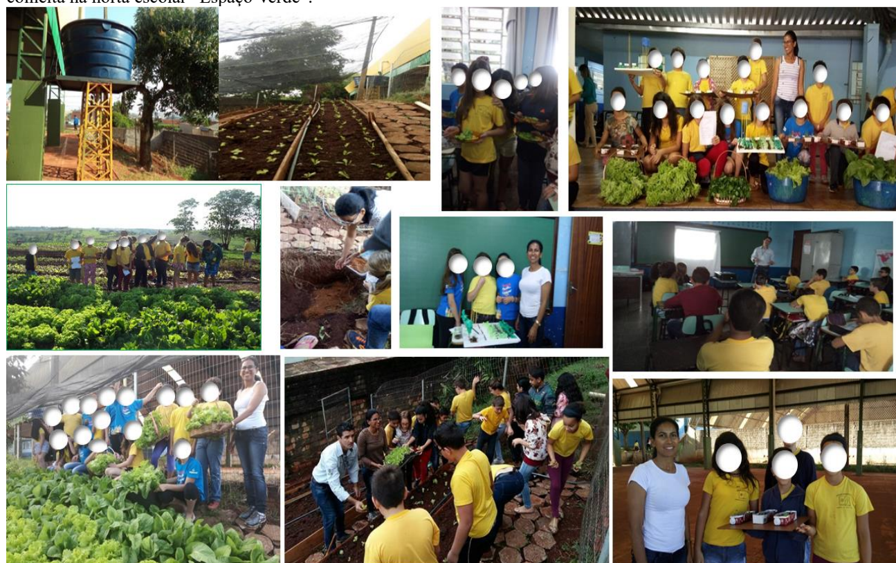
Imagem 01. Registros fotográficos que identificam as ações pedagógicas descritas da “Tabela 01” – temos na montagem: 1) a horta escolar edificada e sua cisterna instalada; 2) alunas comendo as hortaliças da horta; 3) exposição das plantas colhidas na horta para a comunidade escolar; 4) visita técnica à horta orgânica da Comunidade Santa Terezinha; 5) construção da composteira; 6) observação e pesquisa sobre as hortaliças, ervas e verduras; 7) palestras com o técnico da Emater; 8) colheita na horta escolar “Espaço Verde”.

Nossas ações pedagógicas empregaram procedimentos estreitamente ligados aos pressupostos metodológicos da “pesquisa-ação”. Nesse processo, observamos o desenvolvimento de atitudes e comportamentos sustentáveis ao exercício da cidadania, à Educação Ambiental, bem como o desenvolvimento do senso crítico e a compreensão de aspectos que englobam muitas questões ambientais. Veremos melhor isso em nossos resultados.