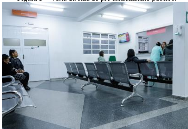
Figura 3 – Vista da sala de pré atendimento público.

A figura 3 apresenta outra importante novidade no HC com uso racional de BIM.