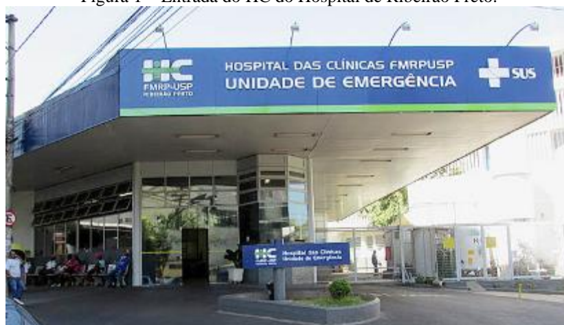
Figura 1 – Entrada do HC do Hospital de Ribeirão Preto.

A seguir tem-se uma foto (figura 1) panorâmica da entrada do HC de Ribeirão Preto.