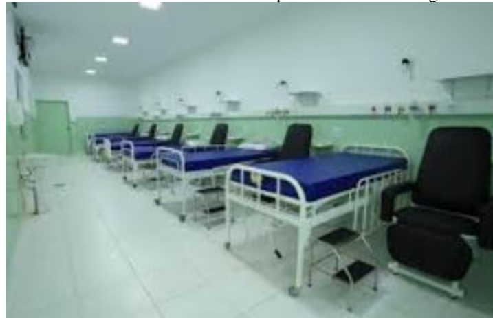
Figura 2 – Novo desenho da sala de acompanhamento de emergência do HC.

Tal gerenciamento possibilitou a implementação de dispositivos melhores adaptados e em consonância com normas modernas de recebimento de pacientes e acompanhantes, como pode ser visualizado na figura 2 (a seguir).