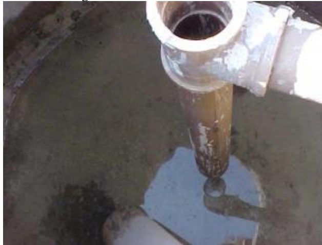
Figura 2: Detalhe interno do RAC.