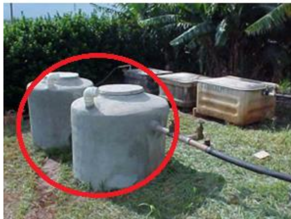
Figura 3: Fase operacional do RAC.

A Figura 3 apresenta uma vista geral do RAC após seu término, com as conexões hidráulicas de entrada e saída do efluente e a tubulação (PVC branco de 100 mm) de entrada para uma mangueira de sucção do lodo, quando necessário para limpeza e descarte.