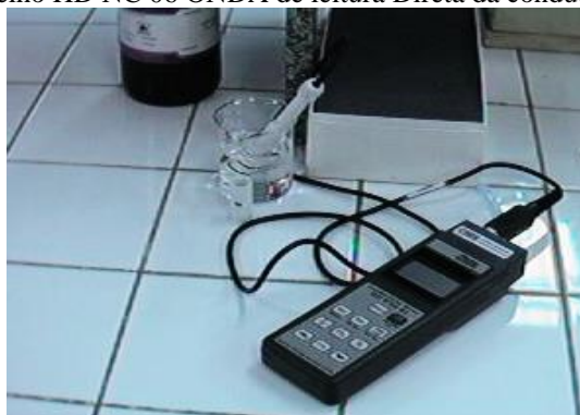
Figura 4: Aparelho HD NC 06 ONDA de leitura Direta da condutividade elétrica.

A leitura de condutividade elétrica foi feita de forma direta com o uso da sonda modelo HD NC 06 ONDA (Figura 4) que efetua as medidas das amostras de água residuárias (esgoto) em micro-siemens ( \mu\text{S} ).