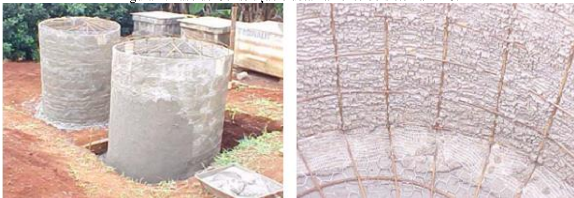
1a: Vista geral do reator.